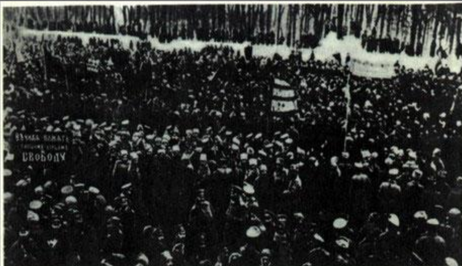
Митинг в Гомеле в дни февральской революции 1917.