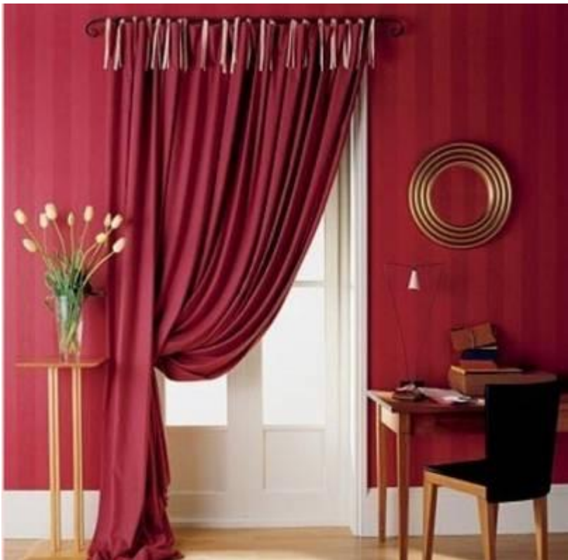
Занавеси на окна и двери