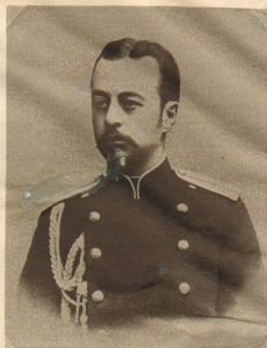
Генералъ-губернаторъ Галицїи, ген.-лейтенантъ, графъ Г. А. Боретскій. (Портретъ снятъ съ Г. А. въ оберъ-офицерскія чины).