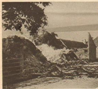
Шансы прощле. Повергнутыя бомбардировкою и сожженныя здания бельгійской городоцк.