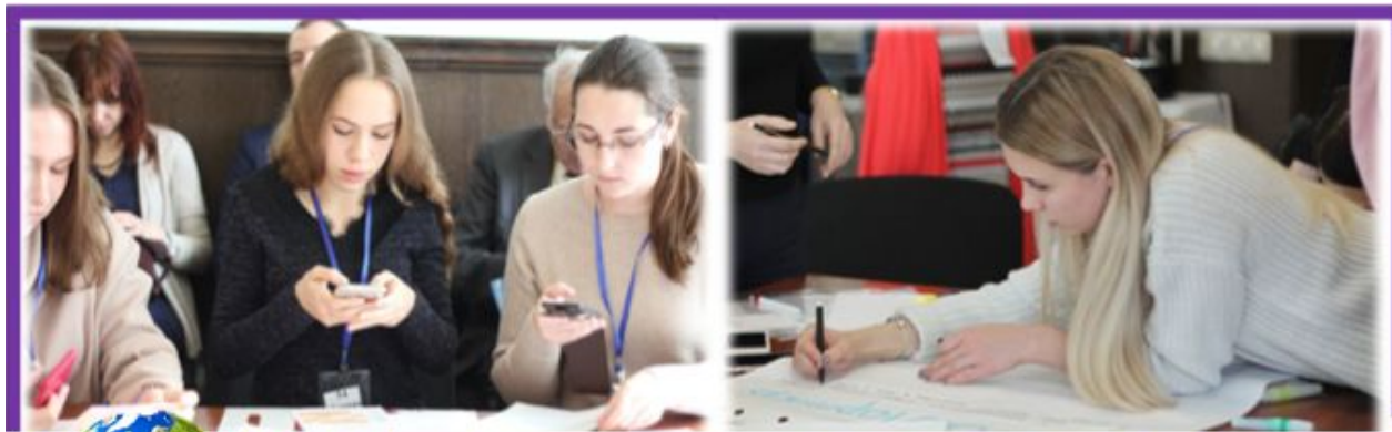
Первый этап конкурса кейсов работодателей «HR РОСТ»

«HR РОСТ» – профессиональный конкурс, целью которого является создание инструмента для повышения качества взаимодействия перспективных HR-специалистов и их будущих работодателей. Работодателями-партнерами конкурса будут предложены HR кейсы, решение которых позволит оценить уровень знаний и профессионального опыта конкурсантов. Лучшие результаты решений кейсов конкурсанты представят на защите перед комиссией экспертов. Весь Конкурс пройдет в несколько этапов и продлится до конца 2021 года, а первая его часть состоится в рамках XI Евразийского экономического форума молодежи «Россия и регионы мира: воплощение идей и экономика возможностей» (XI ЕЭФМ).