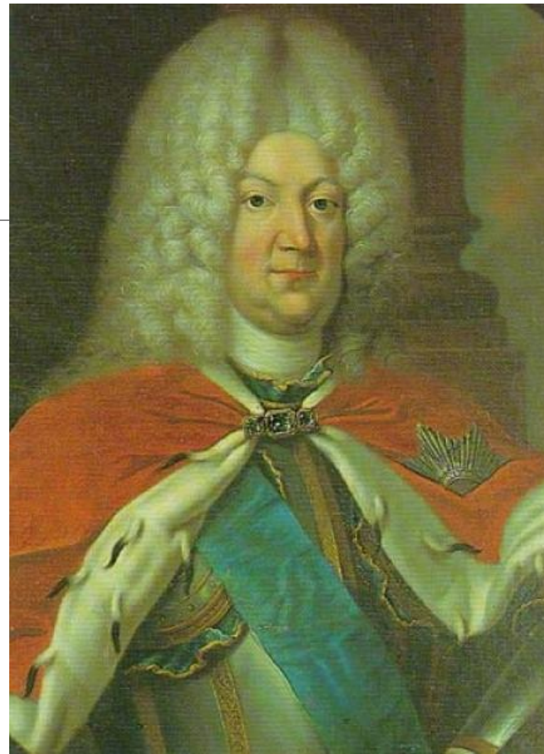
Отец герцога Карл- Леопольд Мекленбург- Шверинский