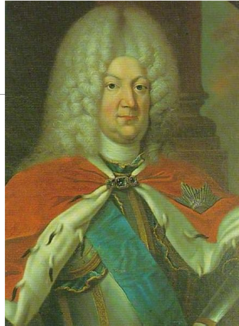
Отец герцога Карл- Леопольд Мекленбург- Шверинский