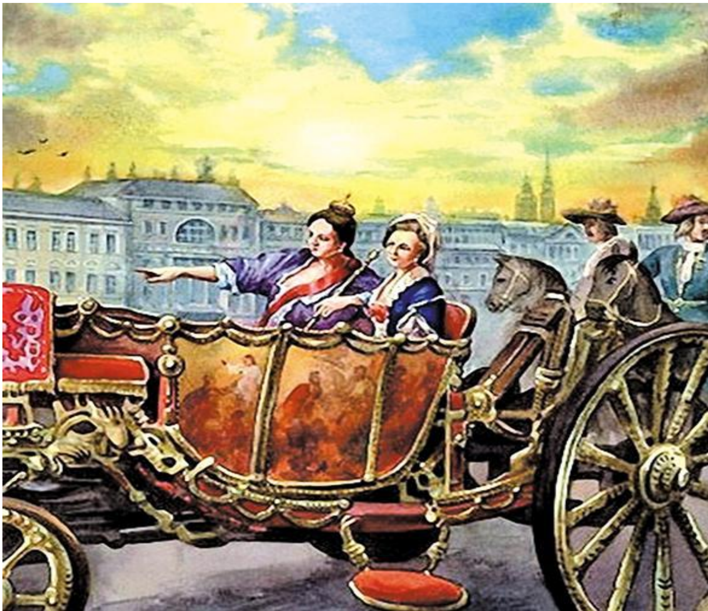
Анна Леопольдовна и Анна Иоанновна в карете