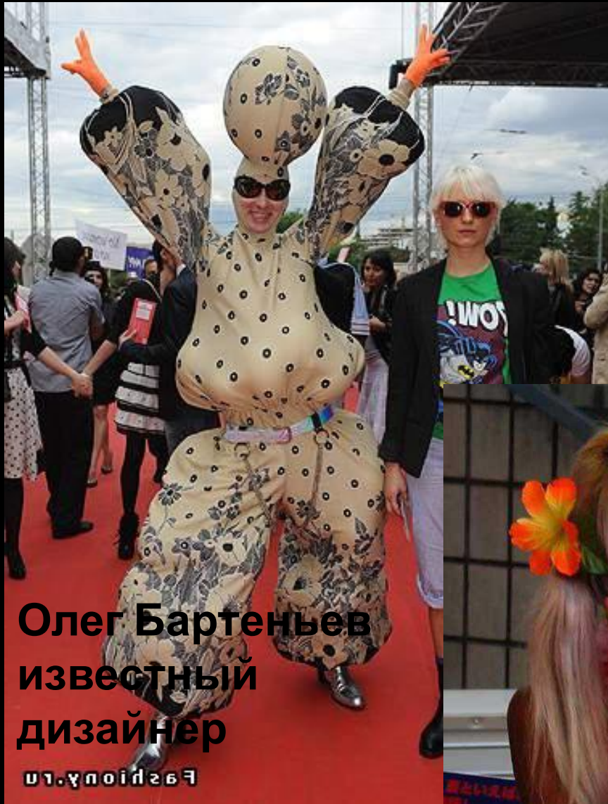
Олег Бартенев известный дизайнер