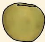
Гренни Смит кислые, не сладкие, низкокалорийные