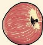
Гала душистые и сладкие