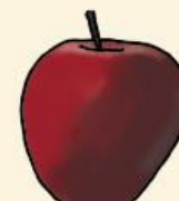
Ред делишес сладкие с легкой горчинкой