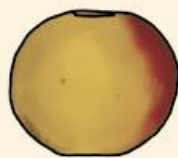
Фуџи сладкие, но вкус не выражен