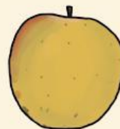
Голден сладкие без кислинки, хороши для пастилы, мармелада