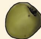
Антоновка насыщенный аромат