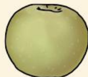
Ренет симиренко пряные с кислинкой