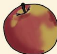
Джанаголд сочные, ароматные, сладко-винный вкус