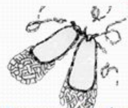
Лапти с оборками