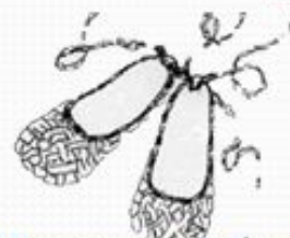
Лапти с оборками