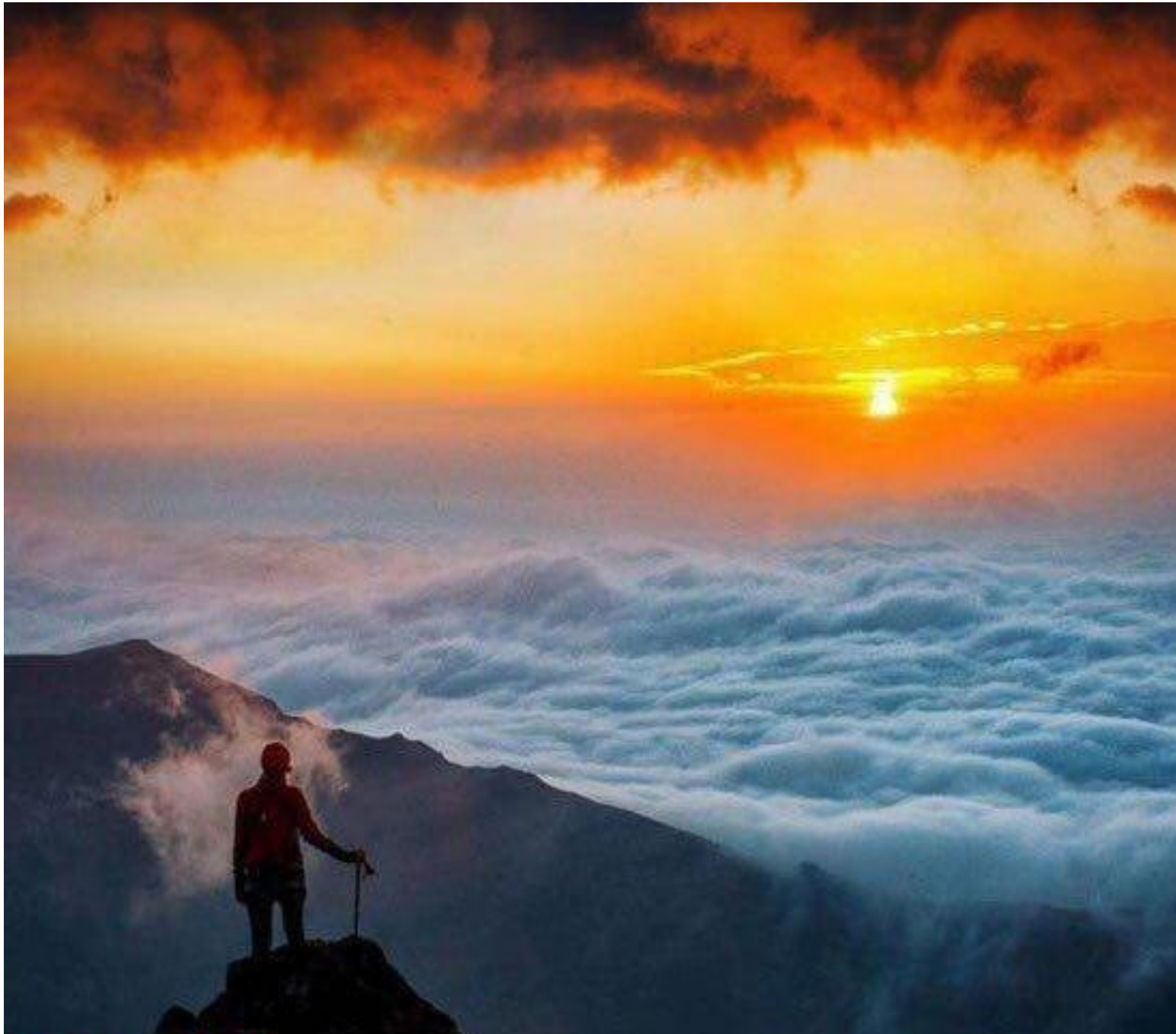
Ардебиль Сабалан 4811 м