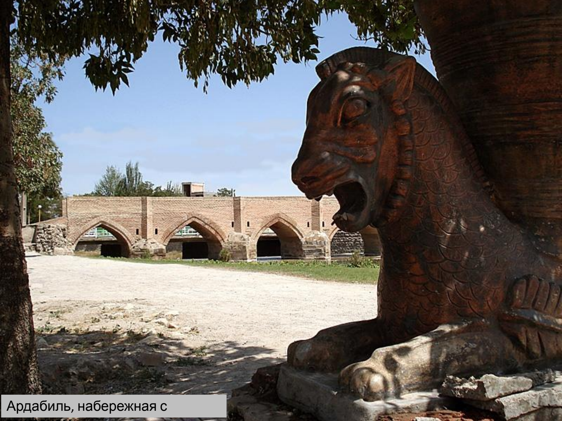
Ардабиль, набережная с