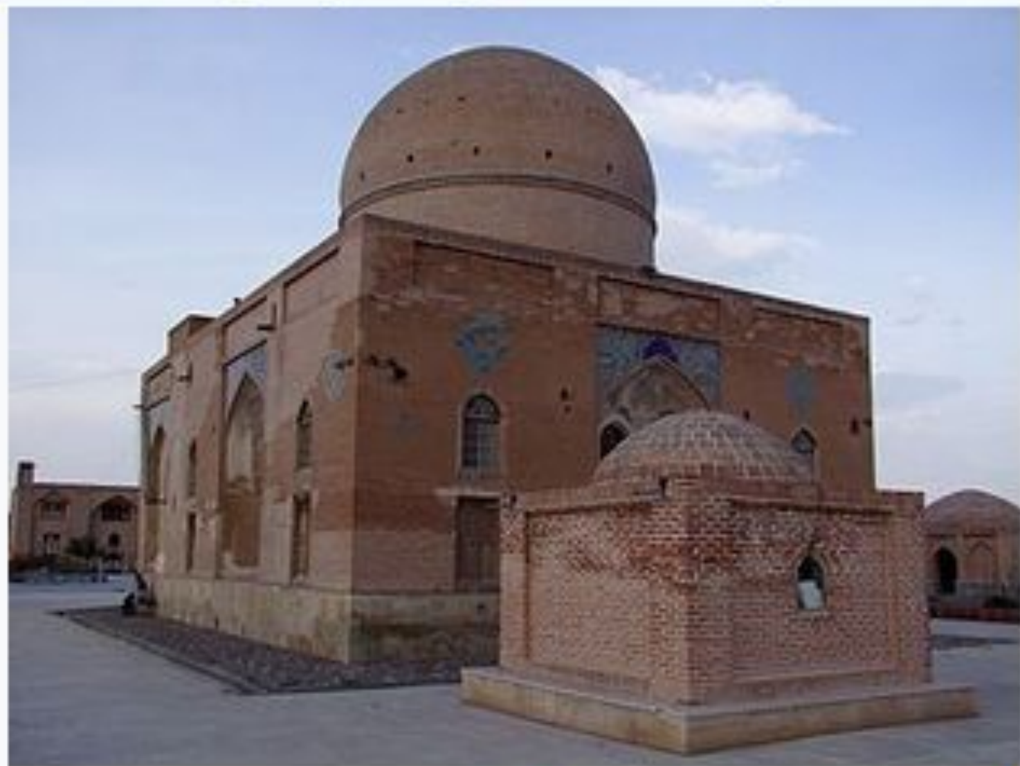
آرامگاه شیخ جبرائیل