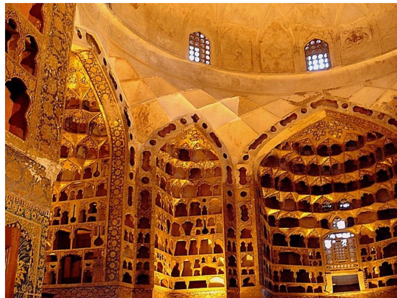
Ардабиль гробница шейха Сафи, Основателя династии Сефевидов, Вид внутри