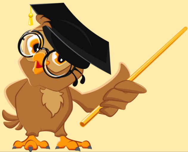
Рисунок дан к основной части (2 абзац)