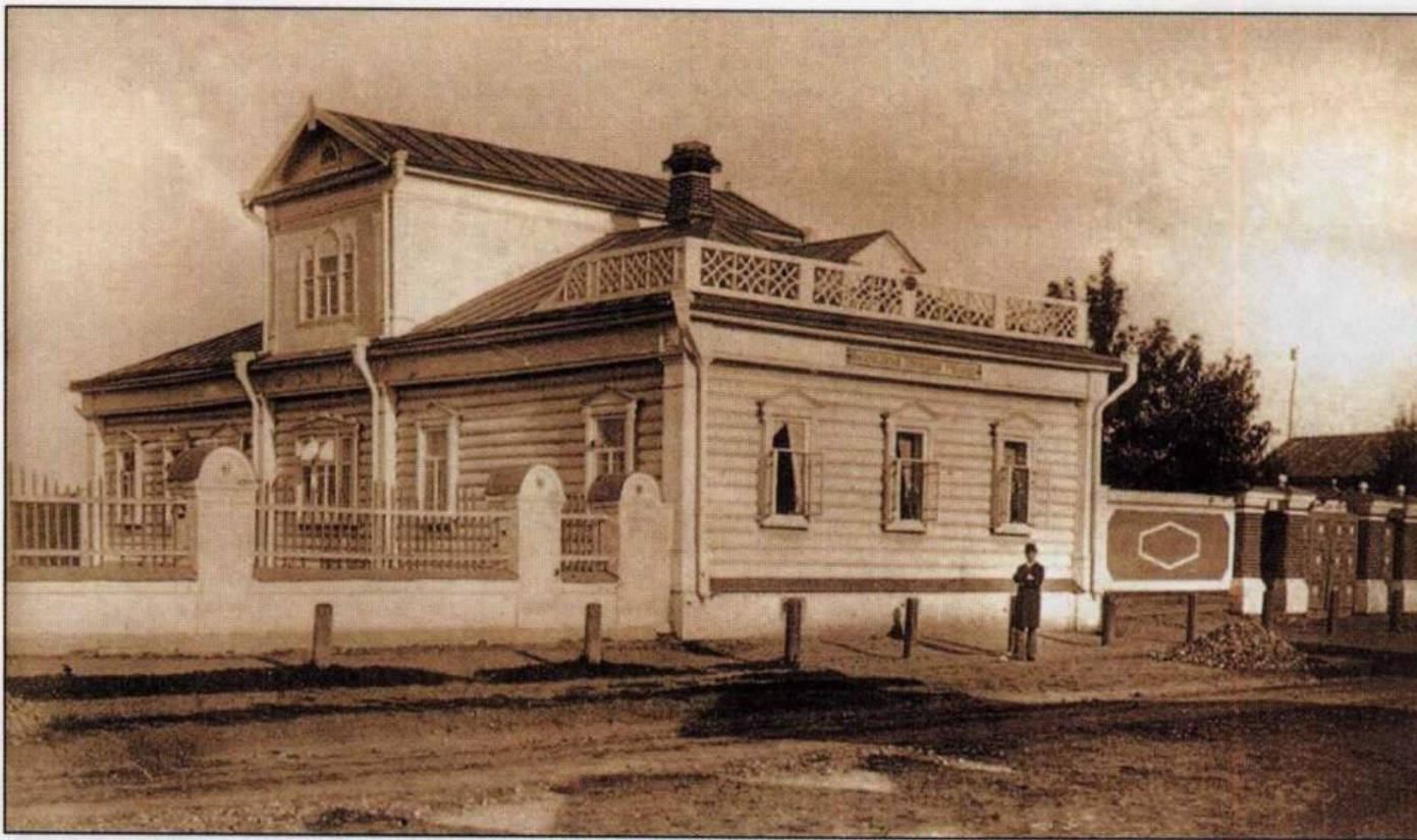
Дом приходского училища.