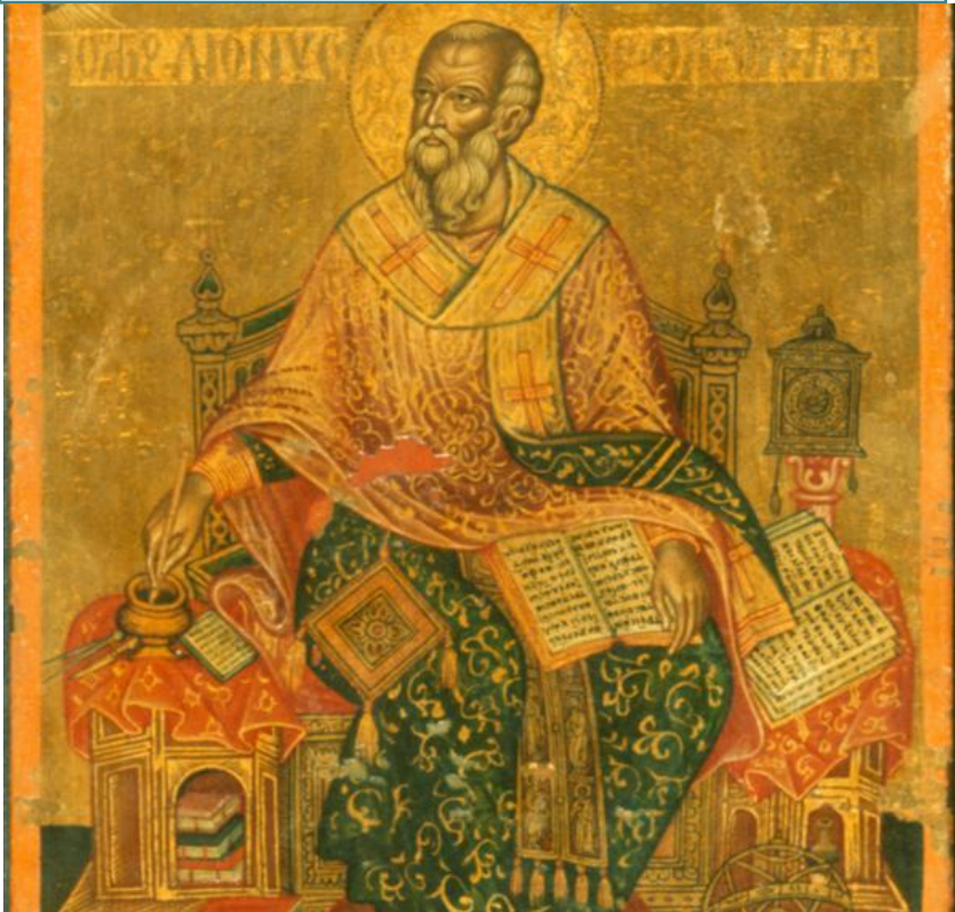
Дионисий Ареопагит (V в. н.э)