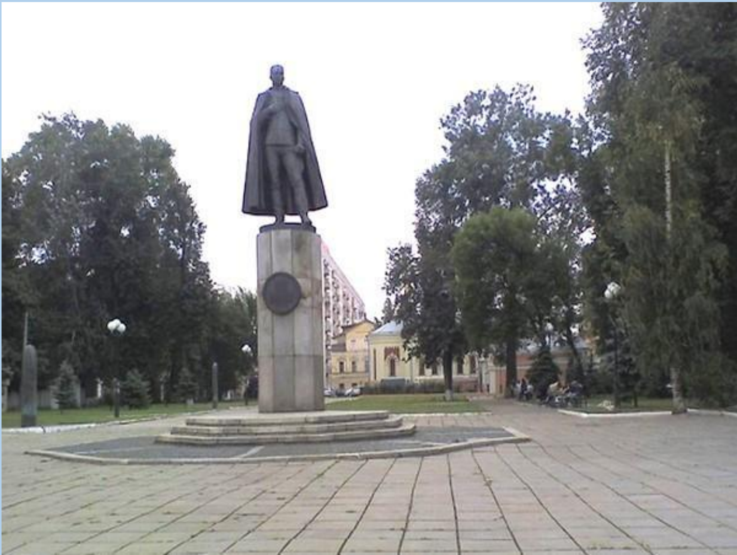
Памятник П.Н.Нестерову в Нижнем Новгороде