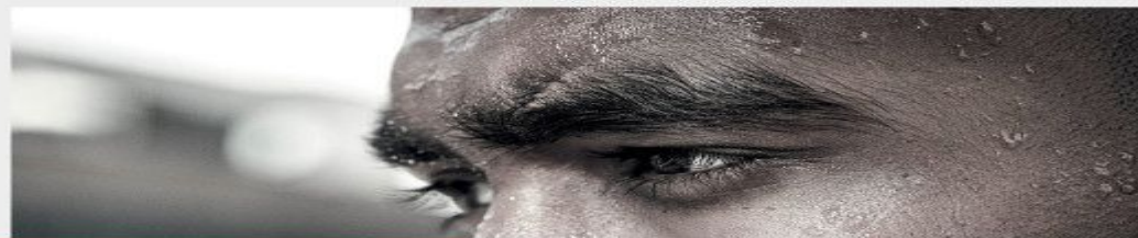
2012: AFTERNOON SPRINT TRAINING