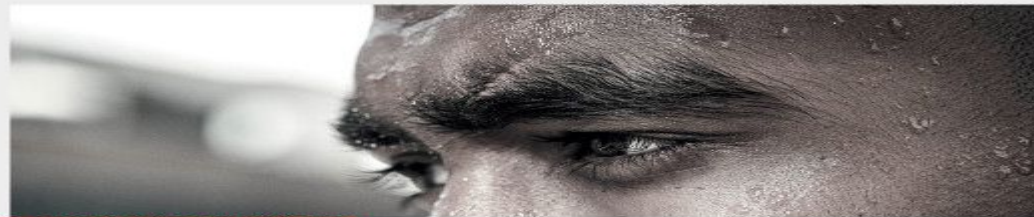
2011: CAUGHT IN A STOLEN CAR

Британская социальная реклама 2013 года от проекта Sported. Три одинаковые фотографии на плакате прокомментированы разным текстом: «2011. Пойман при угоне машины. 2012. Полуденная пробежка. 2013. Работает на кухне в ресторане».