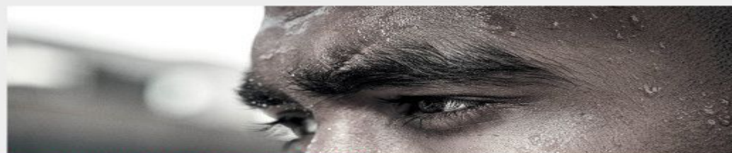
2013: WORKING IN A RESTAURANT KITCHEN