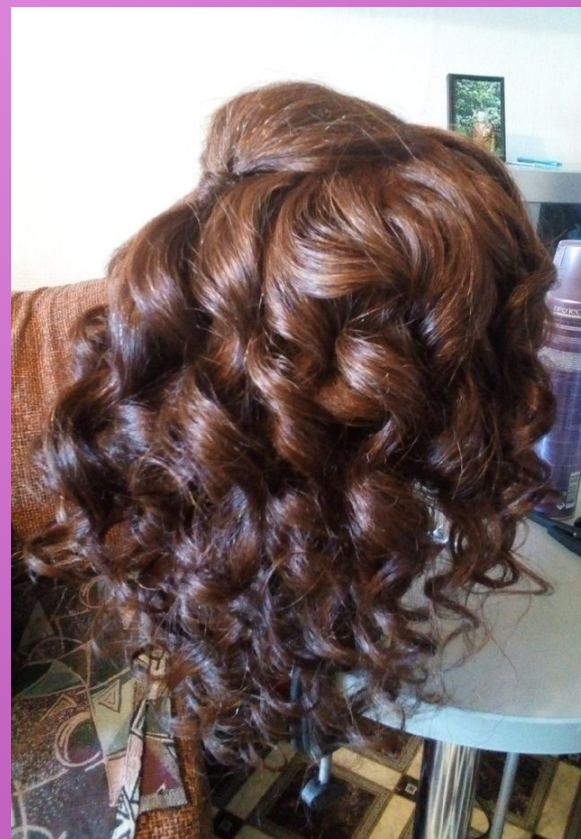
Прическа на выпускной с локонами и начесом.