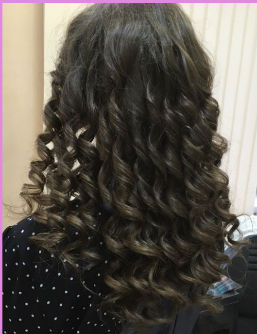
Горячая укладка. Локоны.