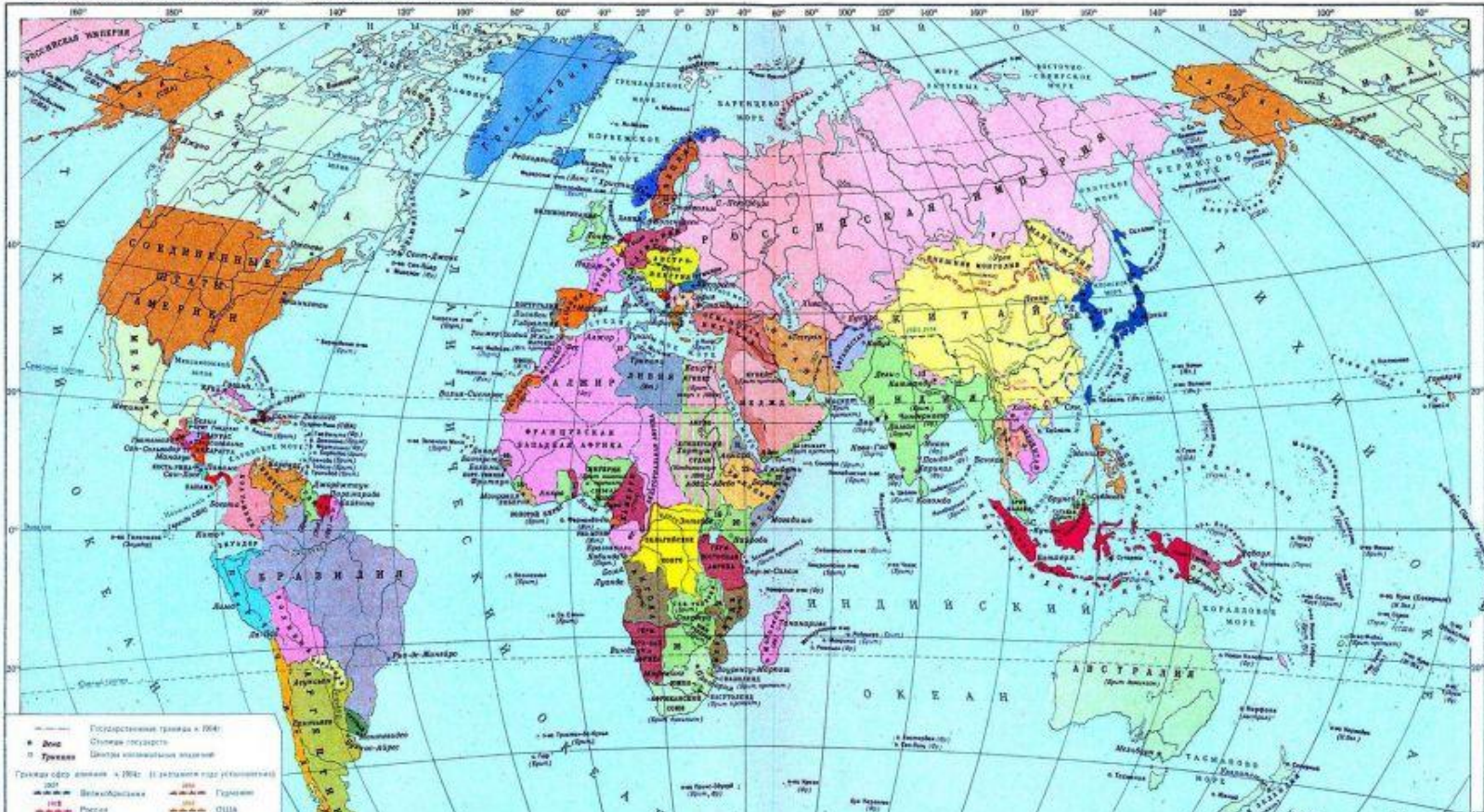
ПОЛИТИЧЕСКАЯ КАРТА МИРА НАКАНУНЕ ПЕРВОЙ МИРОВОЙ ВОЙНЫ