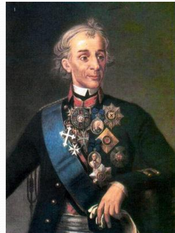
Суворов Александр Васильевич