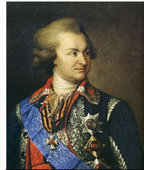
Г. А. Потёмкин