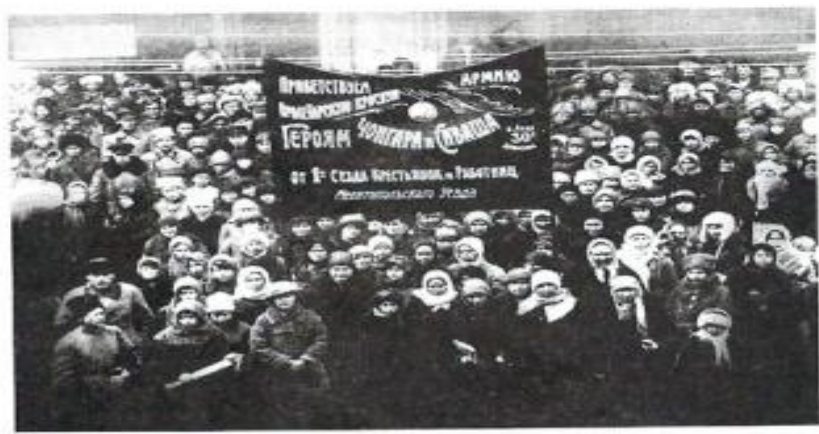
Мелитополь. Делегаты 1-го уездного съезда рабочих и крестьянок. 1920 год