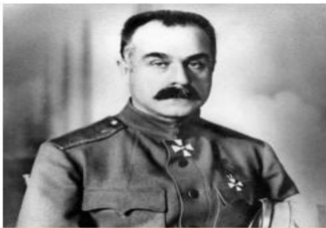
А. М. Каледин

Началось после Октябрьской революции и ликвидации Учредительного собрания в октябре 1917 — январе 1918 года