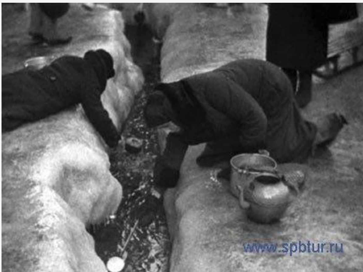
Люди набирали воду из Невы, и других рек