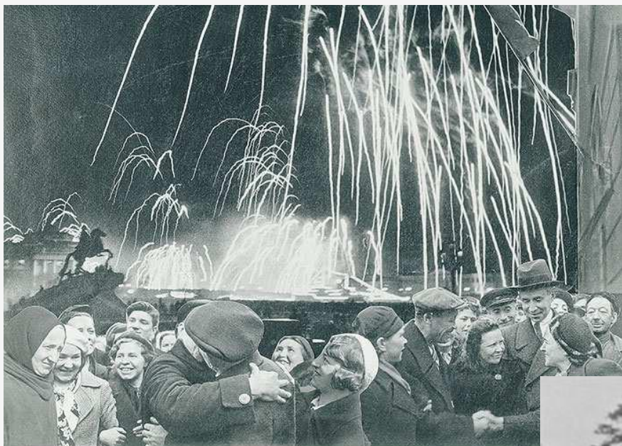
«ВЕЛИКАЯ ПОБЕДА ОДЕРЖАНА СОВЕТСКИМИ ВОЙСКАМИ ПОД ЛЕНИНГРАДОМ»

Вечером 27 января 1944 года над Ленинградом грохотал праздничный салют.