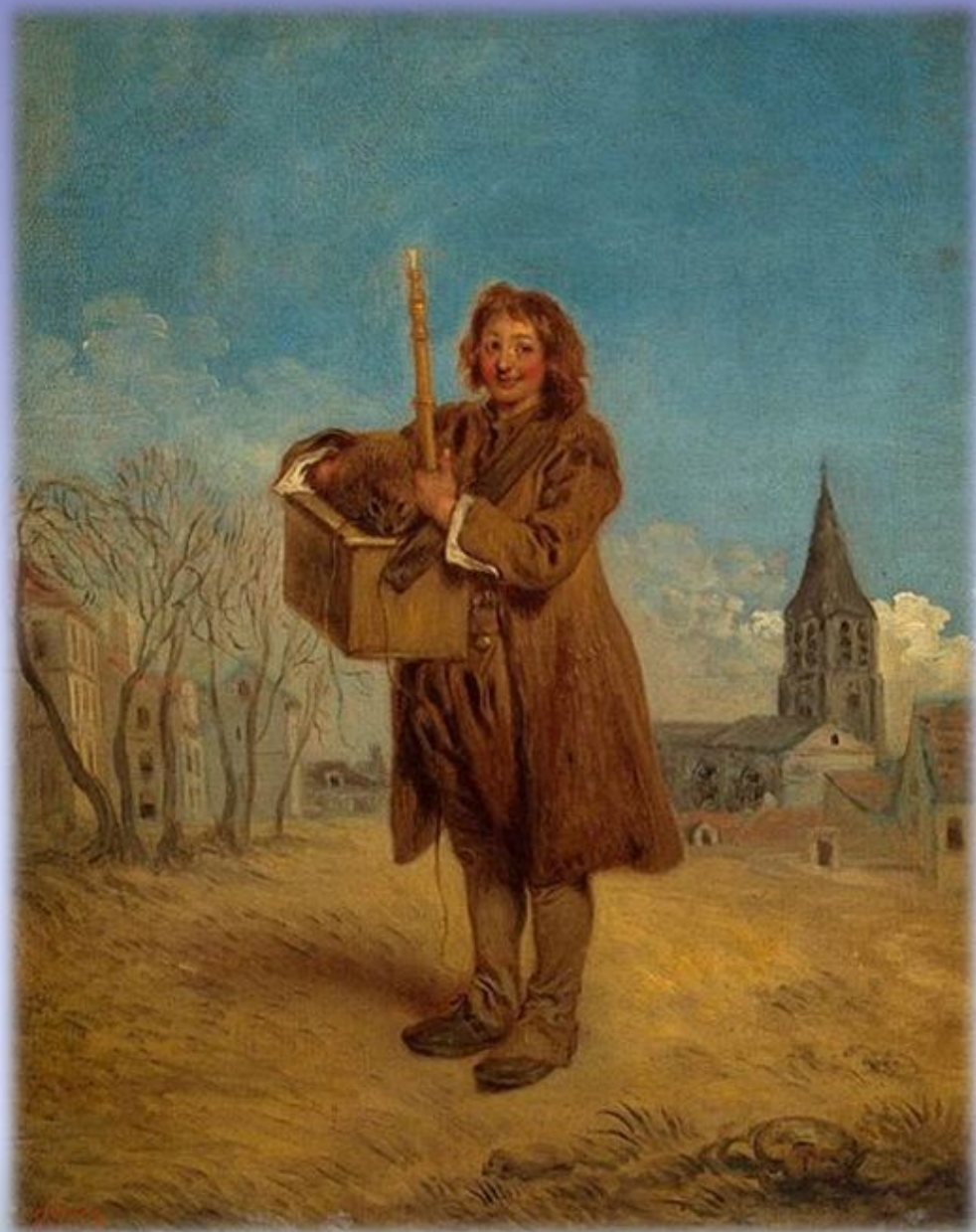
Антуан Ватто «Савояр с сурком»