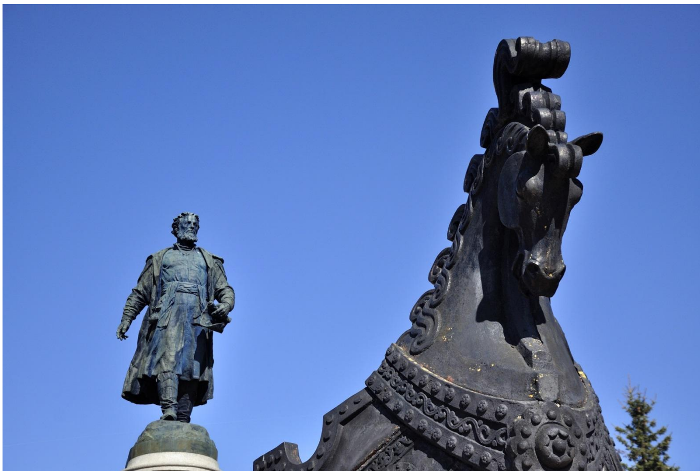
(памятник Никитину в Твери)

Так о путешествии Никитина стало известно всем. Сегодня памятники Никитину установлены в Индии и в родной Твери.