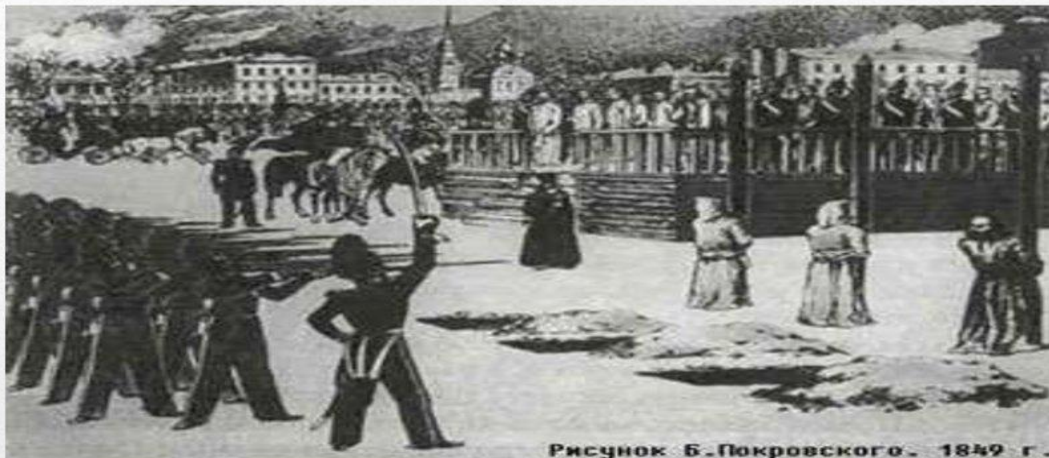
Рисунок Б. Покровского. 1849 г.

22 декабря 1849. В последнюю минуту объявили настоящий приговор: каторга и солдатчина (4 года каторги и поселение). Григорьев сошел с ума.