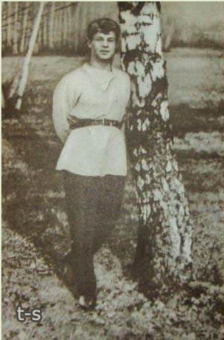
Сергей Есенин у березы. Фото - 1918 год.