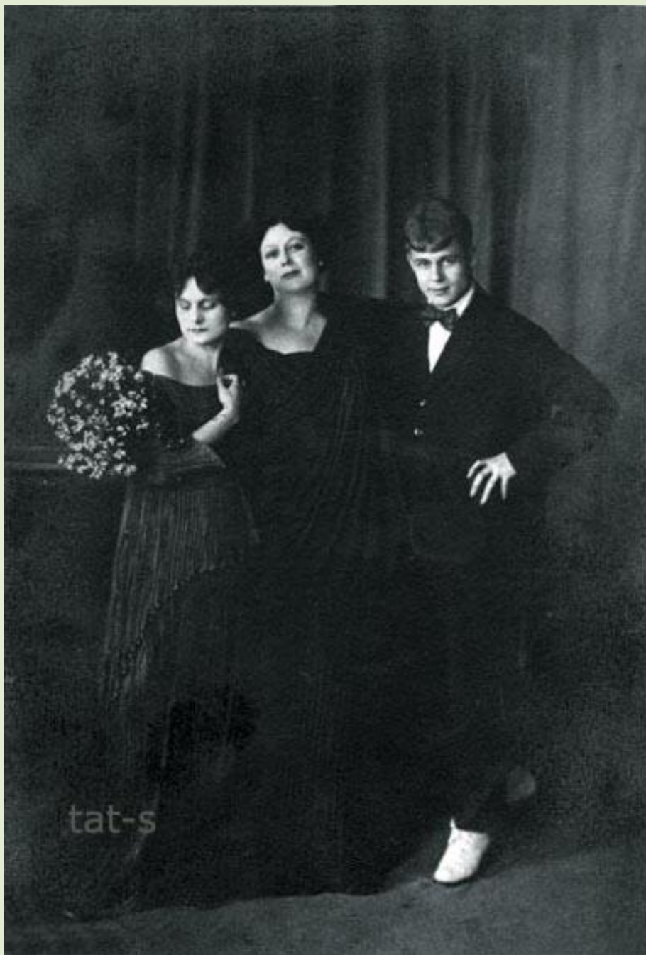
Приемная дочь Айседоры Ирма Дункан (1898 - 1978), Айседора Дункан, Сергей Есенин. Москва. Фото - май, 1922 год.