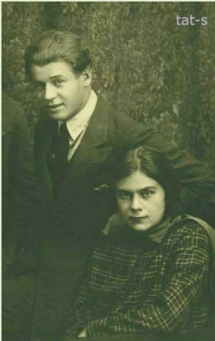
Сергей Есенин и его последняя жена Софья Андреевна Толстая-Есенина (1900 - 1957). Фото - 1925 год.