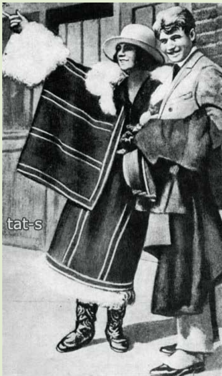
Сергей Есенин и Айседора Дункан на пароходе "Paris". Фото - октябрь 1922 год.