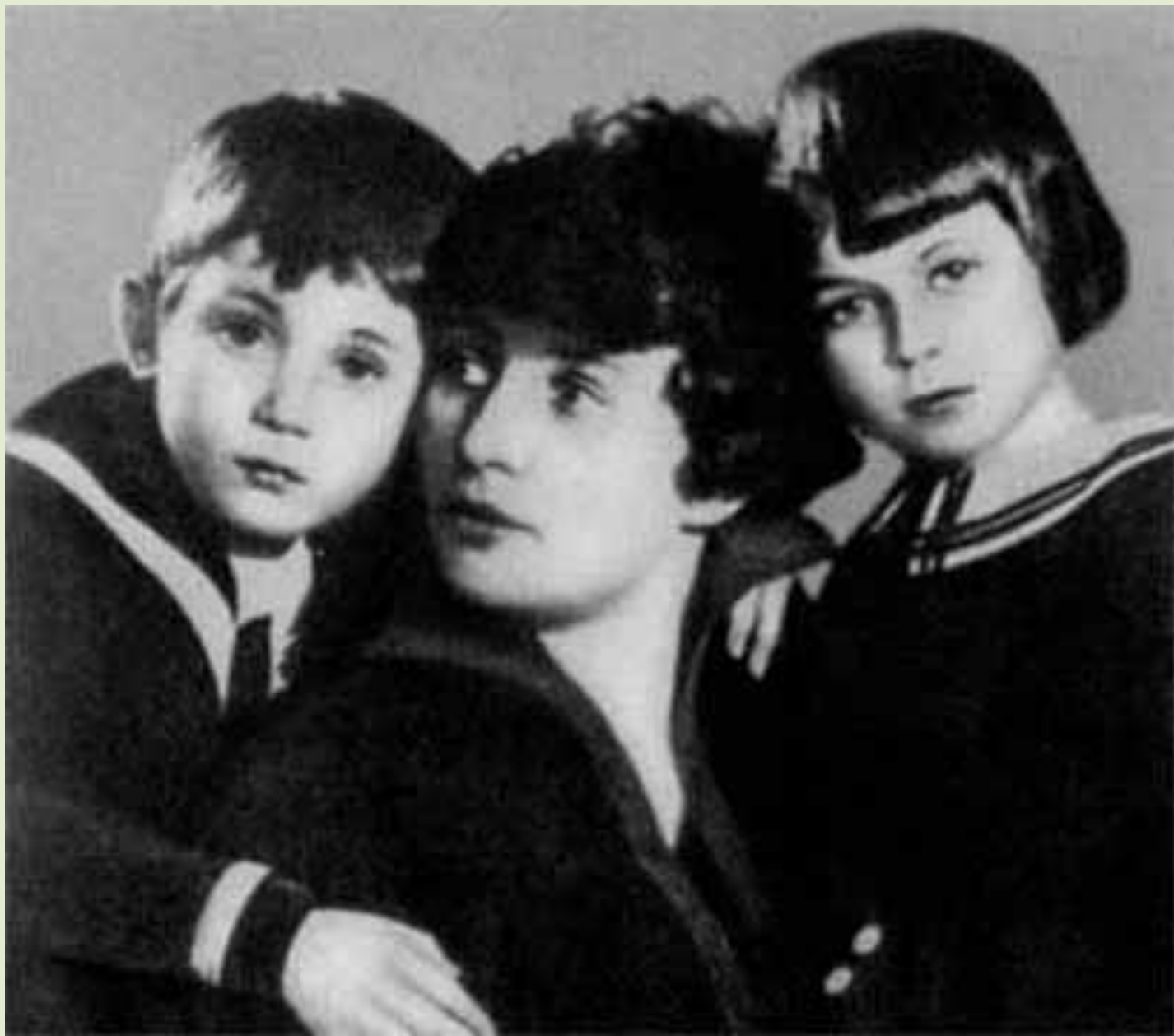
Дети Сергея Есенина и Зинаиды Райх