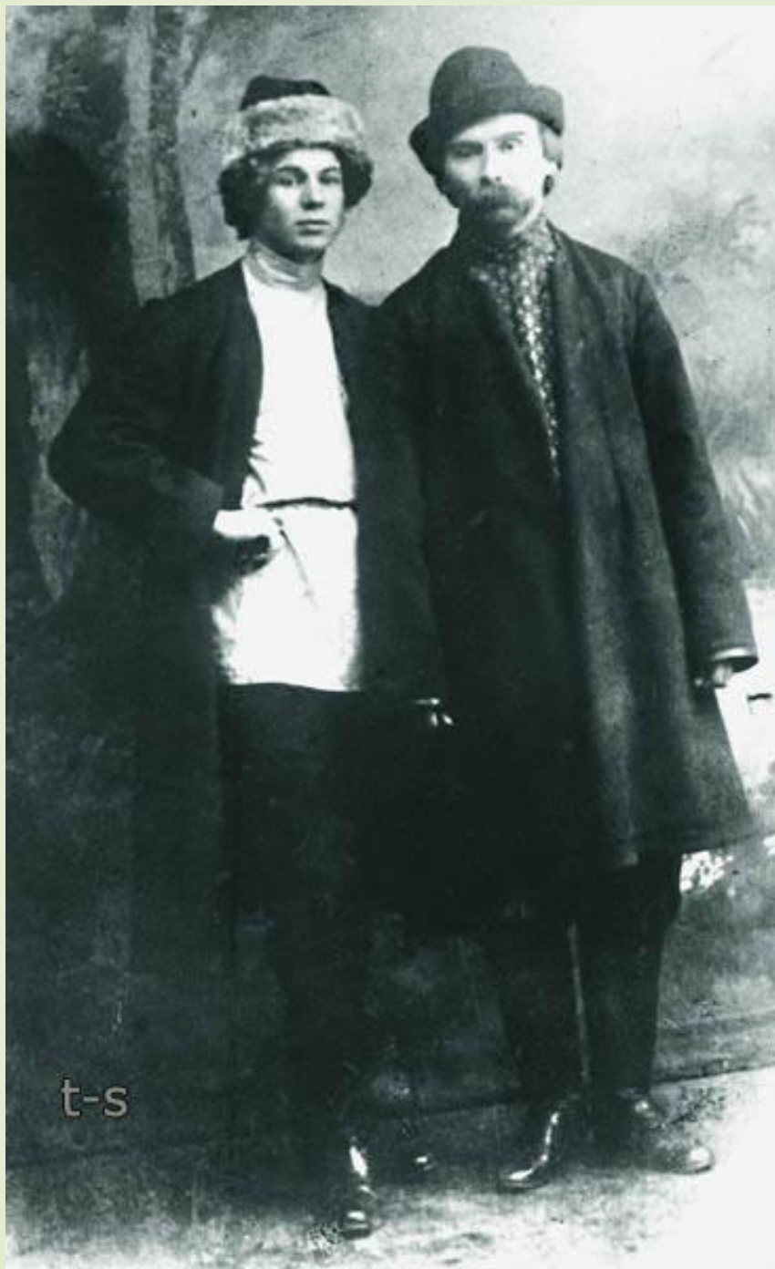
Поэты - Сергей Есенин (слева) и Николай Клюев Фото - 1916 год.