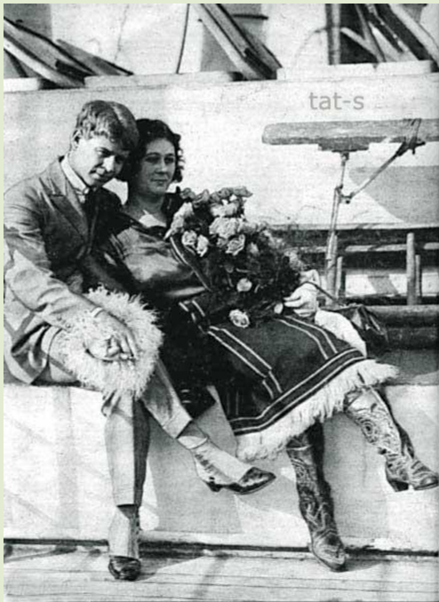
Сергей Есенин и Айседора Дункан