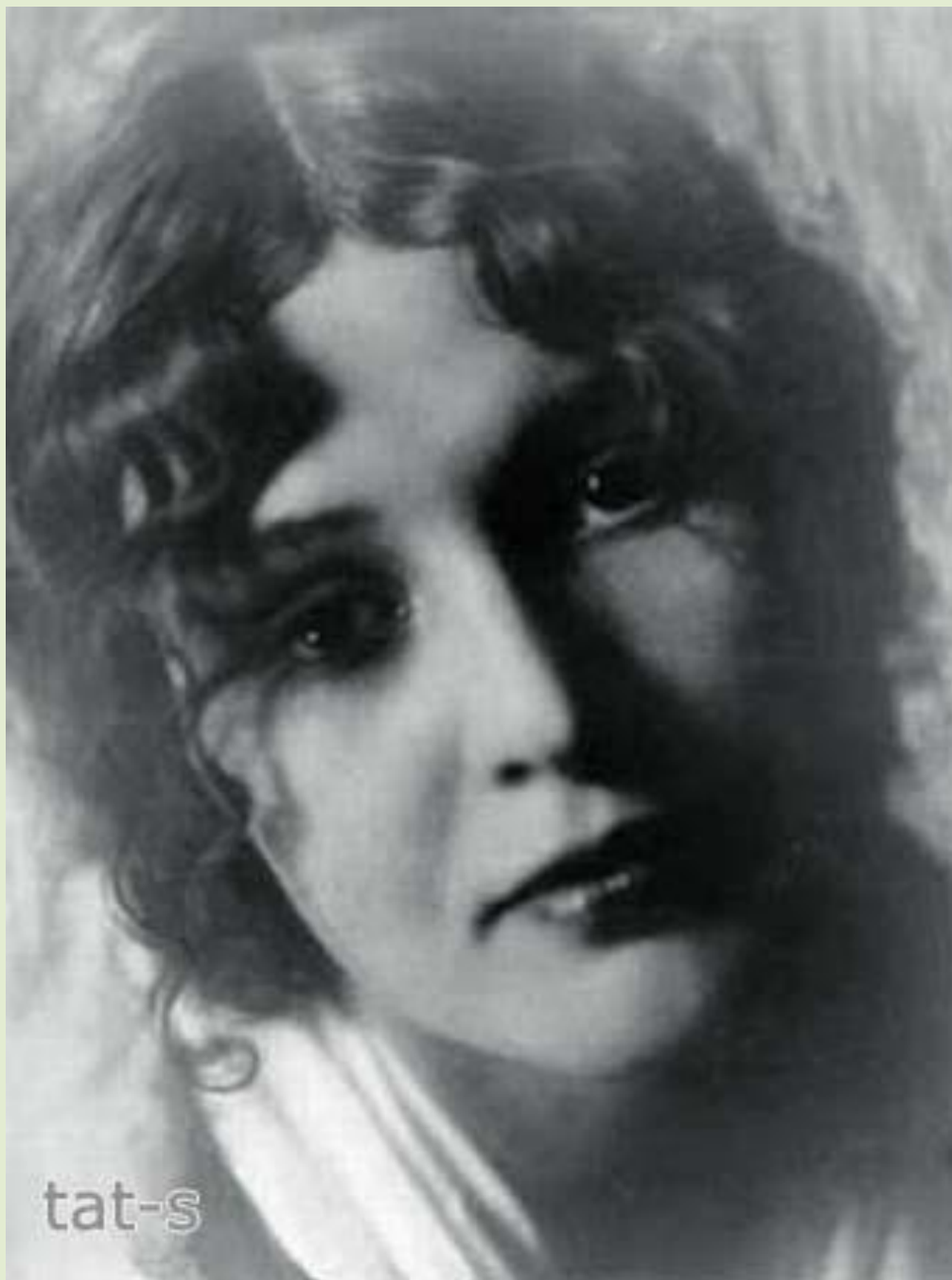
Жена Есенина, актриса - Зинаида Николаевна Райх (1894 - 1939)