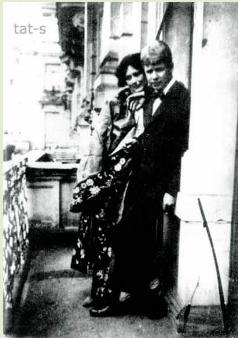
Сергей Есенин и Айседора Дункан, на улицах Венеции. Фото - август 1922 год.