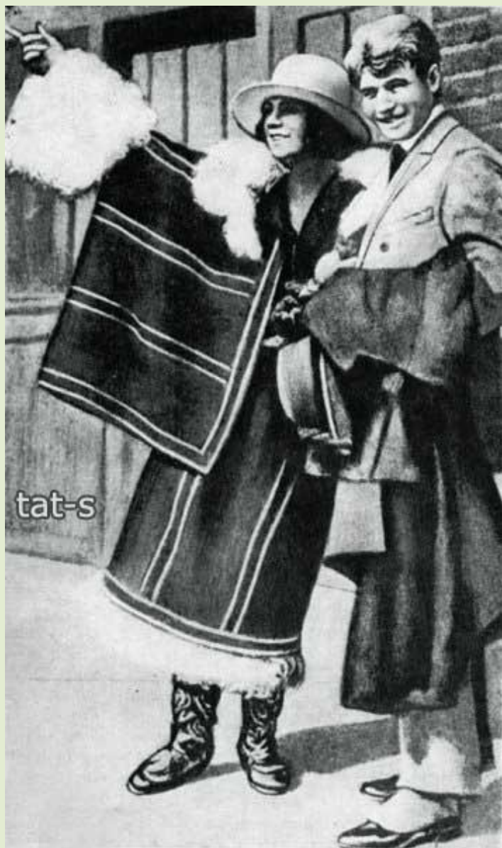
Сергей Есенин и Айседора Дункан на пароходе "Paris". Фото - октябрь 1922 год.