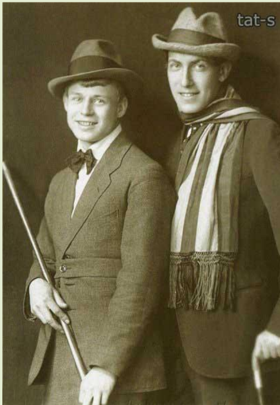
Сергей Есенин (слева) и Анатолий Борисович Мариенгоф (1897 - 1962). Москва, лето. Фото -1919 год.