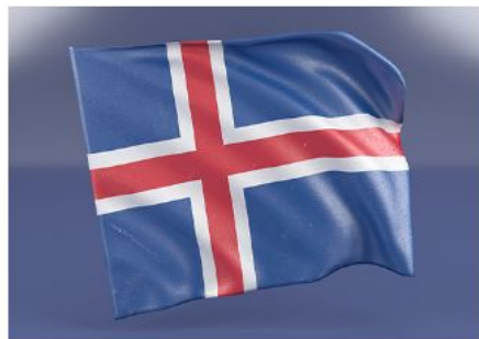
Назначение судей в Апелляционный суд Исландии противоречит принципу суда.