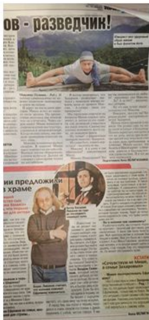
Коллажи Портреты Цвет/чб