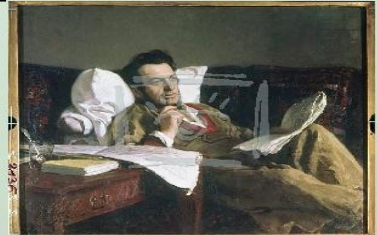
Книга в жизни Обломова