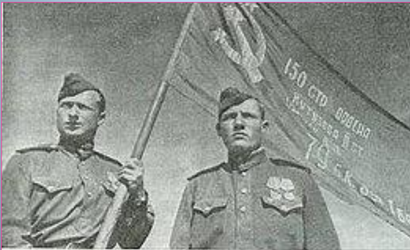
Командиры 756-го полка 150-й стрелковой дивизии М. А. Егоров (слева) и И. В. Кантария со Знаменем Победы, Берлин, Май 1945.