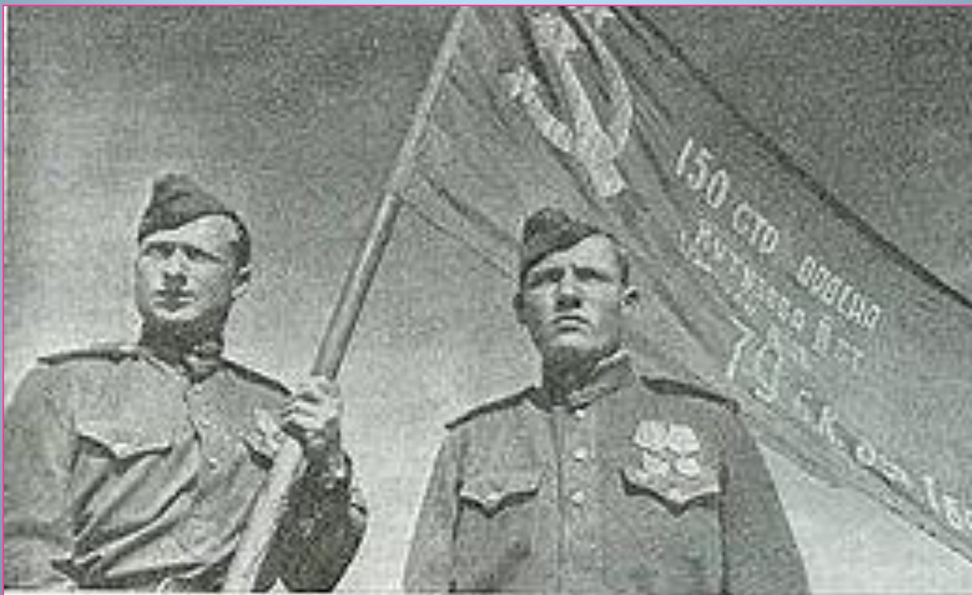
Командир 756-го полка 150-й стрелковой дивизии М. А. Егоров (справа) и И. В. Кантария со Знаменем Победы, Берлин, Май 1945.