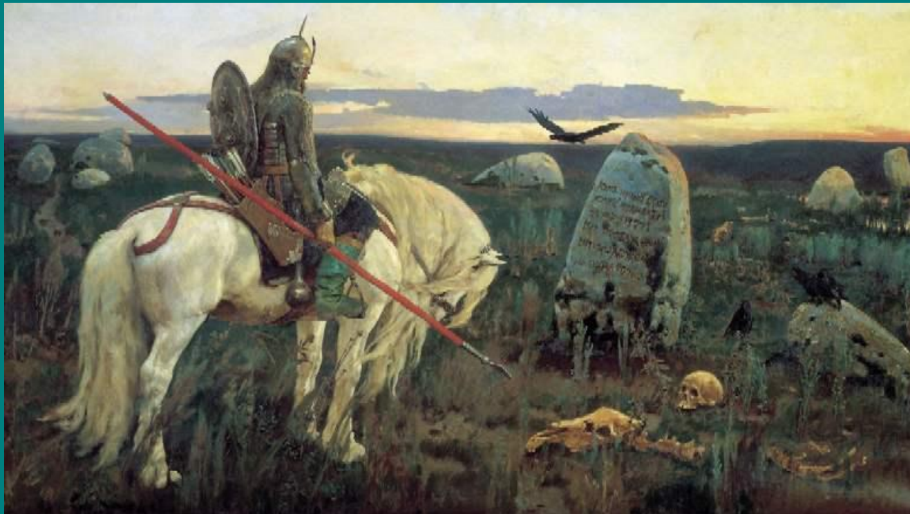
«Витязь на распутье» 1982