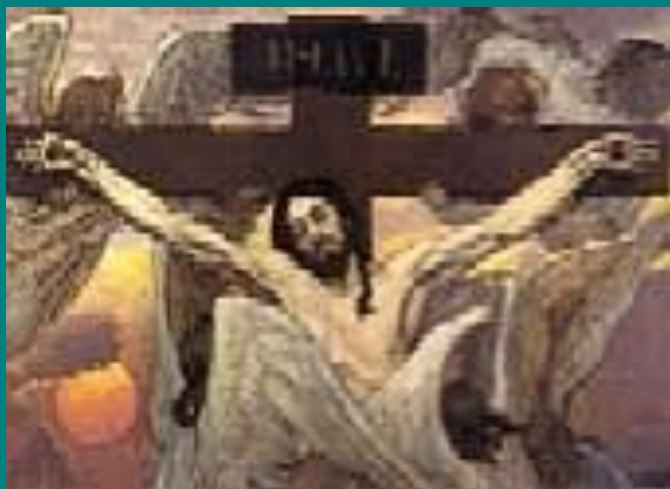
Распятый Иисус Христос