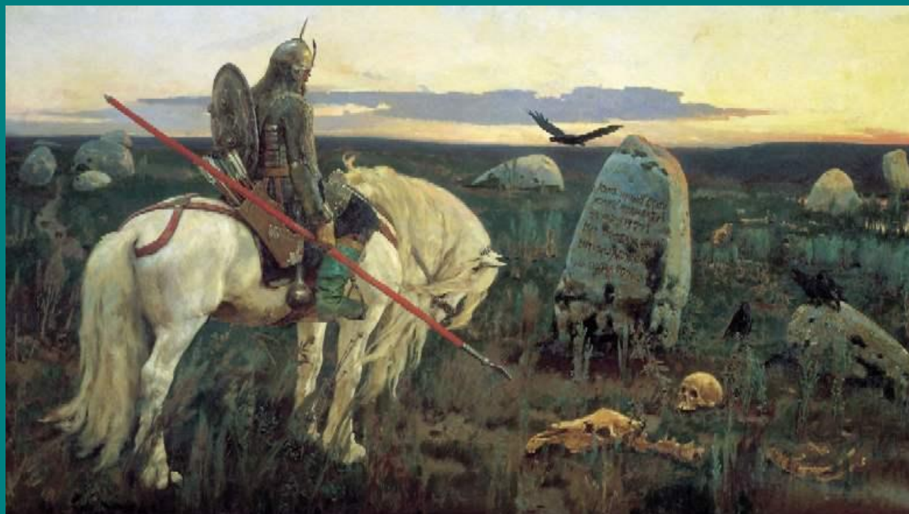
«Витязь на распутье» 1982