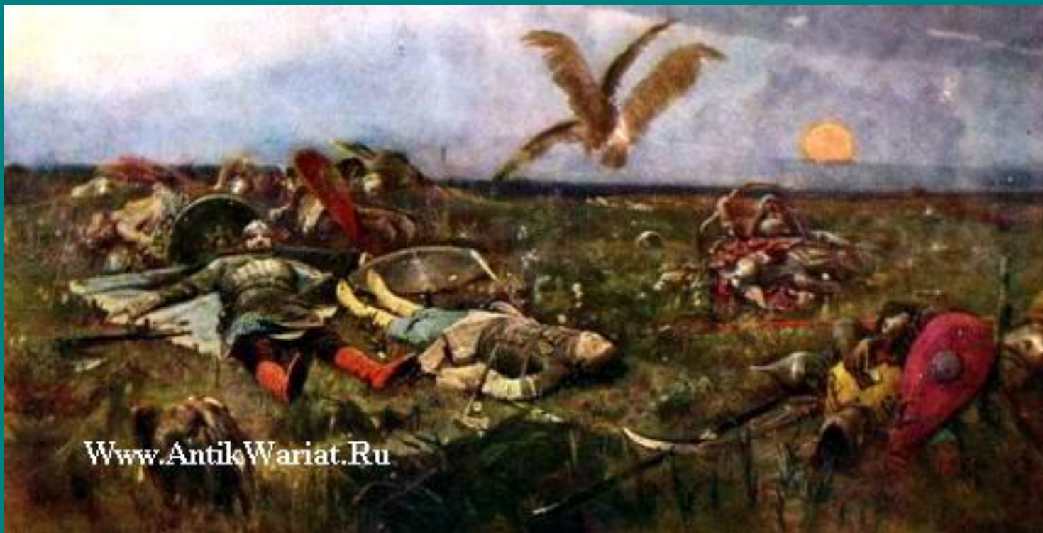
«После побоища Игоря Святославича с половцами» 1880