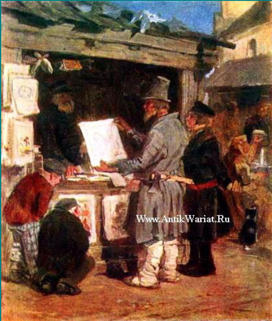
«Книжная лавочка» 1876