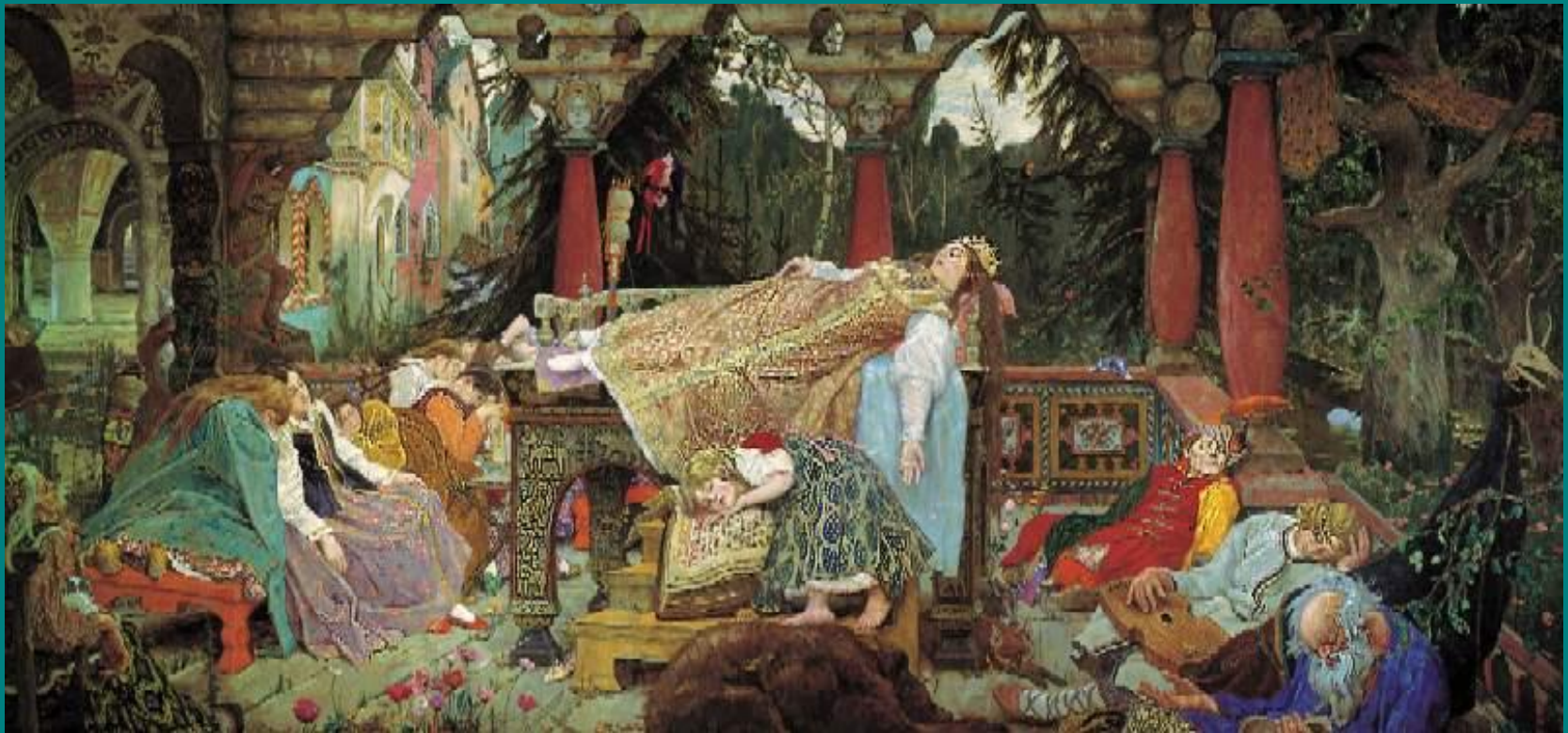
«Спящая царевна» 1926