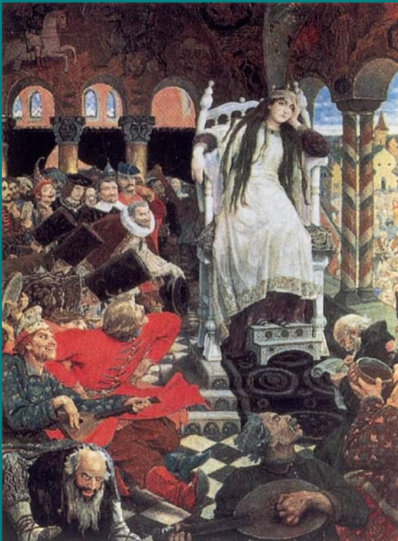
«Царевна Несмеяна» 1926