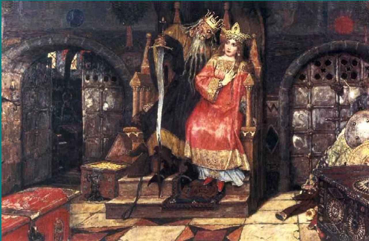
«Кощей Бессмертный» 1926