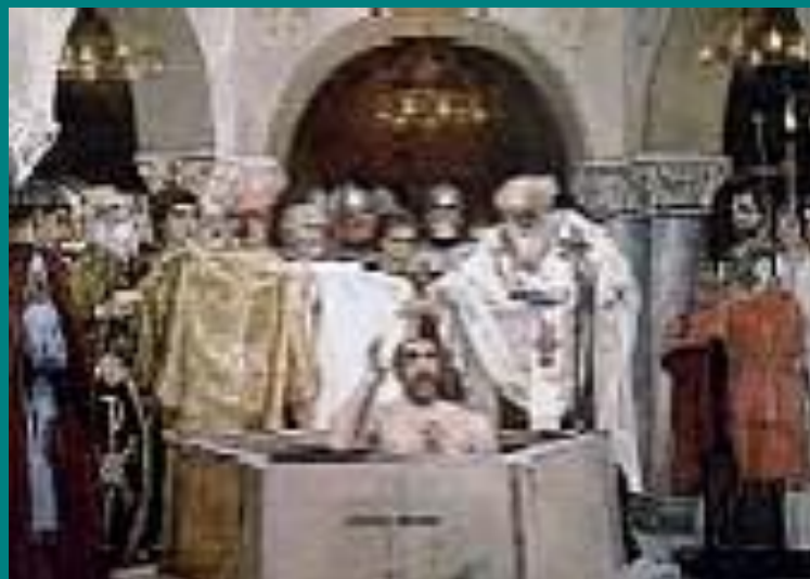
Крещение князя Владимира