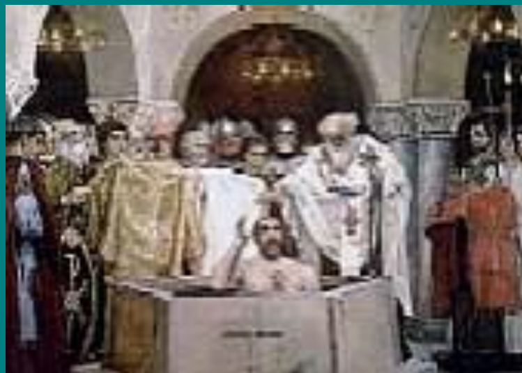
Крещение князя Владимира