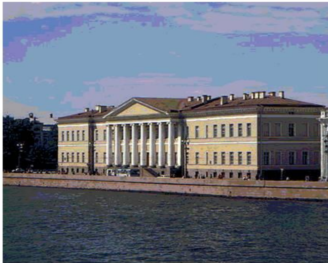
Здание Академии наук в Петербурге