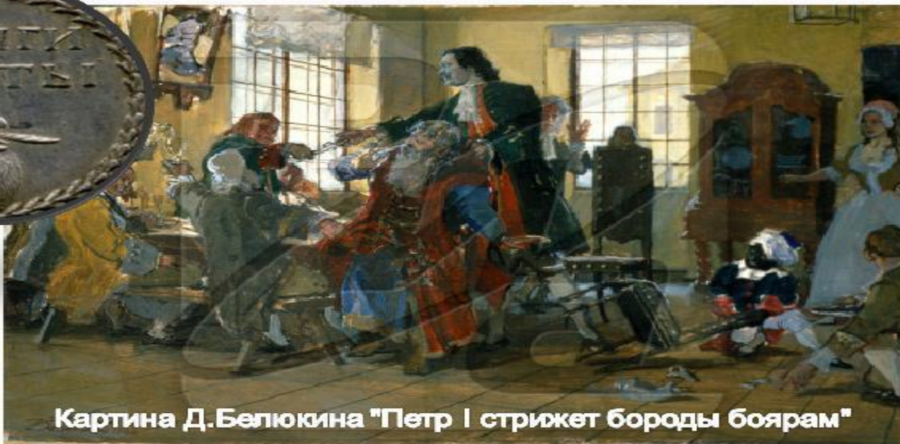
Картина Д.Белюкина "Петр I стрижет бороды боярам"