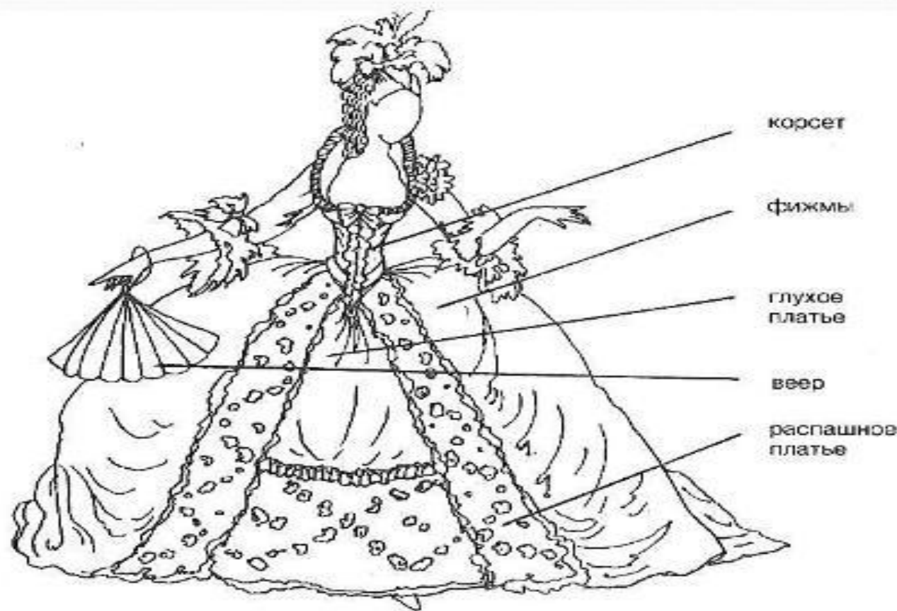
Женский костюм. XVIII в.