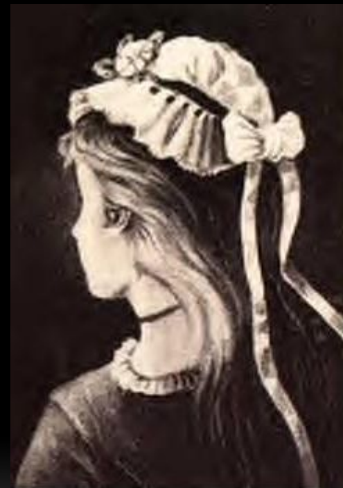
Old Woman...Or Young Girl?