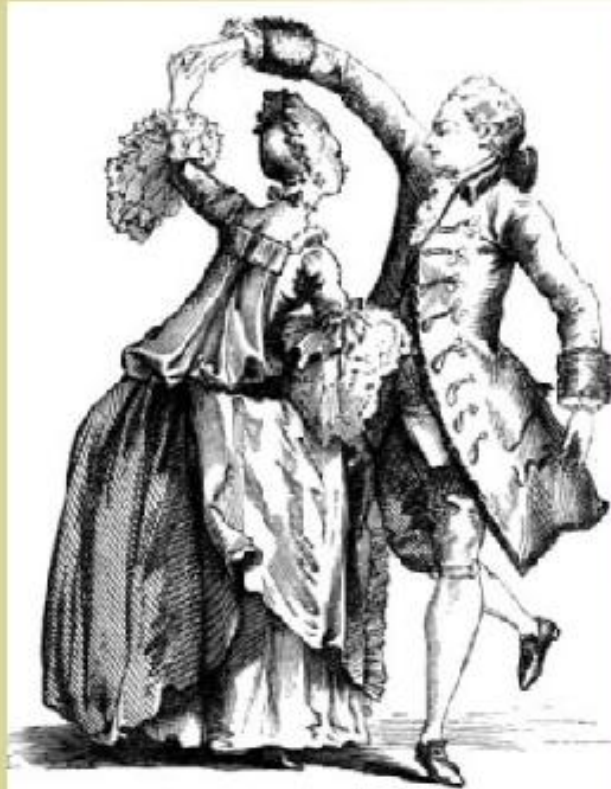
Costume habillé d'hiver en 1762, d'après Saint-Aubin.