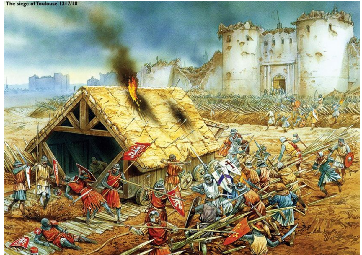
Поход против еретиков- альбигойцев