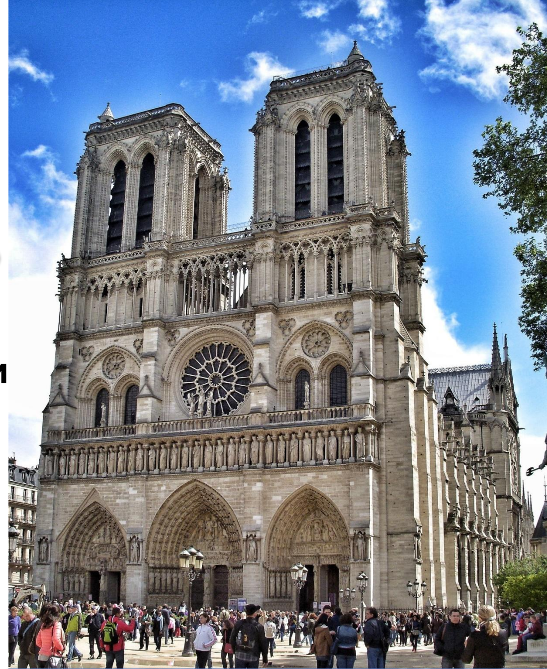
Собор Парижской Богоматери