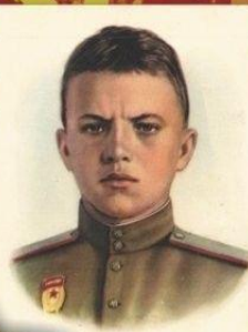
МАТРОСОВ Александр Матвеевич (1924-1943)

Военный лётчик, капитан, командир эскадрильи. Погиб 26 июня 1941 года совершая огненный таран: направил горящую машину на механизированную колонну врага.