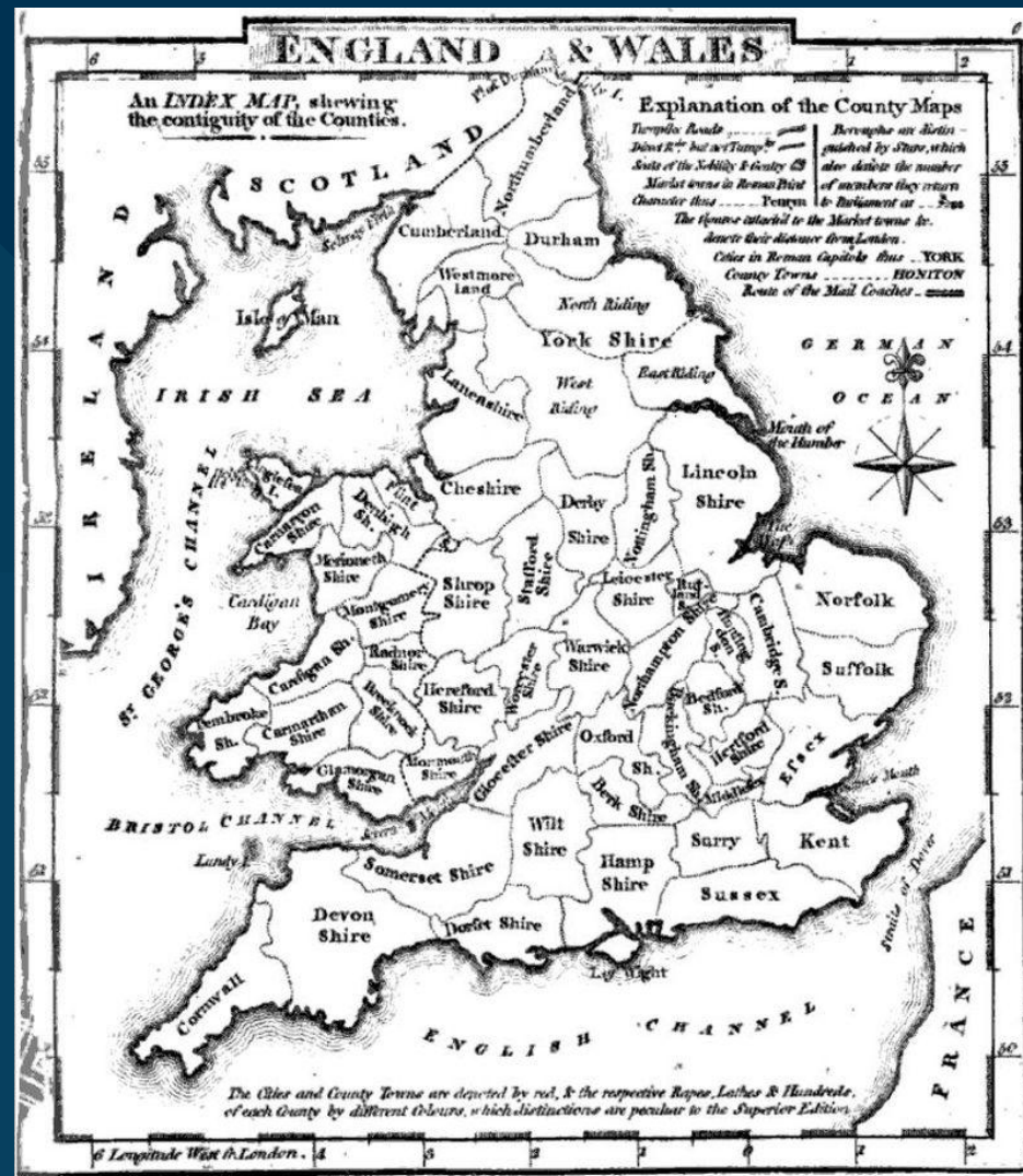
Карта графств Англии до реформы (1824)