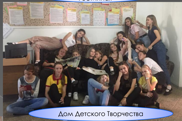
Дом Детского Творчества