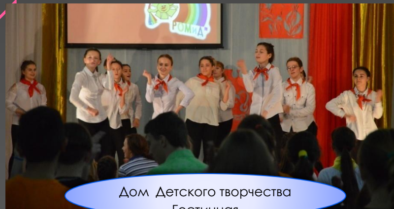
Дом Детского творчества Гостиная