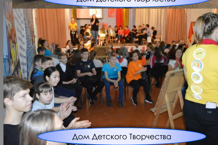
Дом Детского Творчества