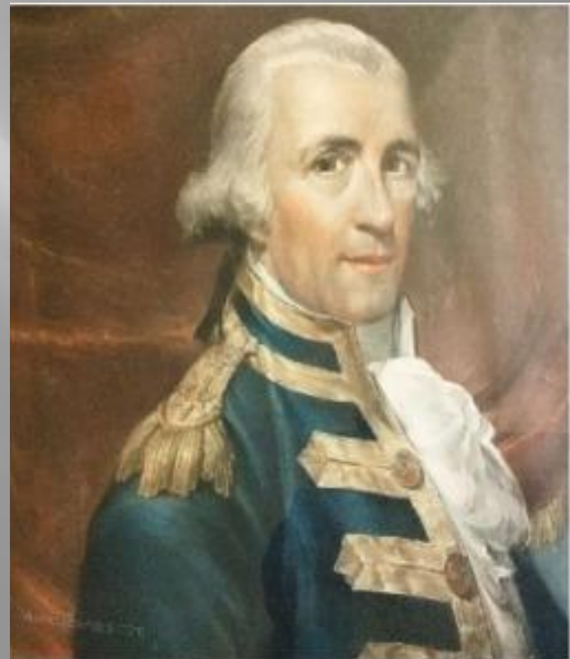
Вице-адмирал Г. Ватранг