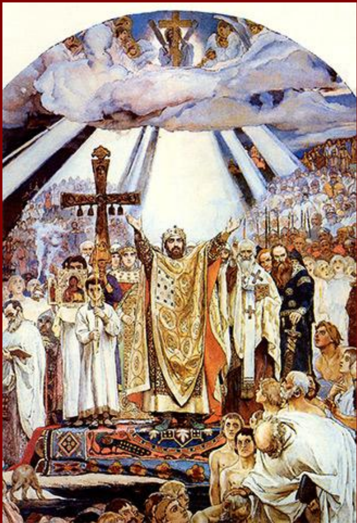
В. М. Васнецов. Крещение Руси.