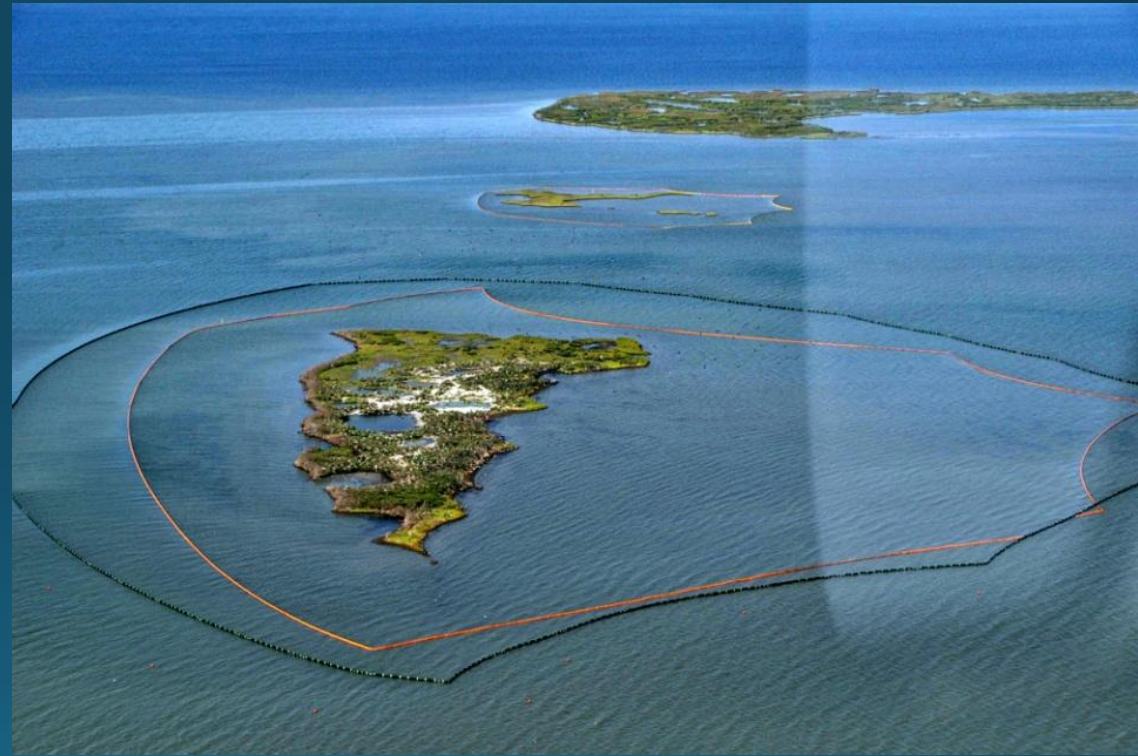
Боны вокруг островов препятствуют попаданию нефти к местам гнездования птиц

Причем в ряде случаев, несмотря на колоссальные достижения современной науки, ликвидировать определенные виды химического, а также радиоактивного загрязнения в настоящее время невозможно. Несколько лучше обстоит дело с нефтяным загрязнением.