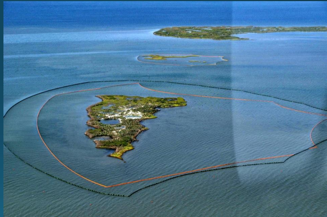
Боны вокруг островов препятствуют попаданию нефти к местам гнездования птиц

Причем в ряде случаев, несмотря на колоссальные достижения современной науки, ликвидировать определенные виды химического, а также радиоактивного загрязнения в настоящее время невозможно. Несколько лучше обстоит дело с нефтяным загрязнением.