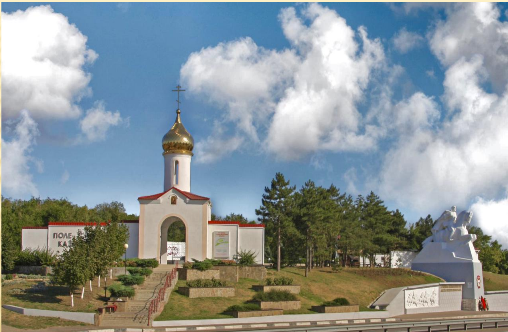
МАРШРУТ ПОБЕДЫ муниципального образования Кущёвский район Краснодарского края «Легендарная Кущёвская атака»