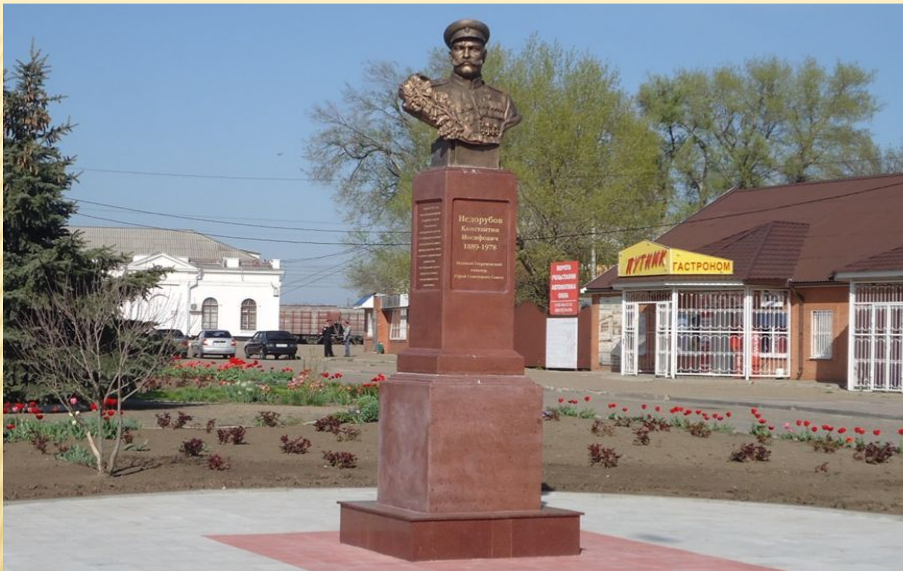
Точка №8. Памятник Герою Советского Союза, полному Георгиевскому кавалеру Недорубову К.И.. Установлен на привокзальной площади станции Кущёвка в 2015 году.