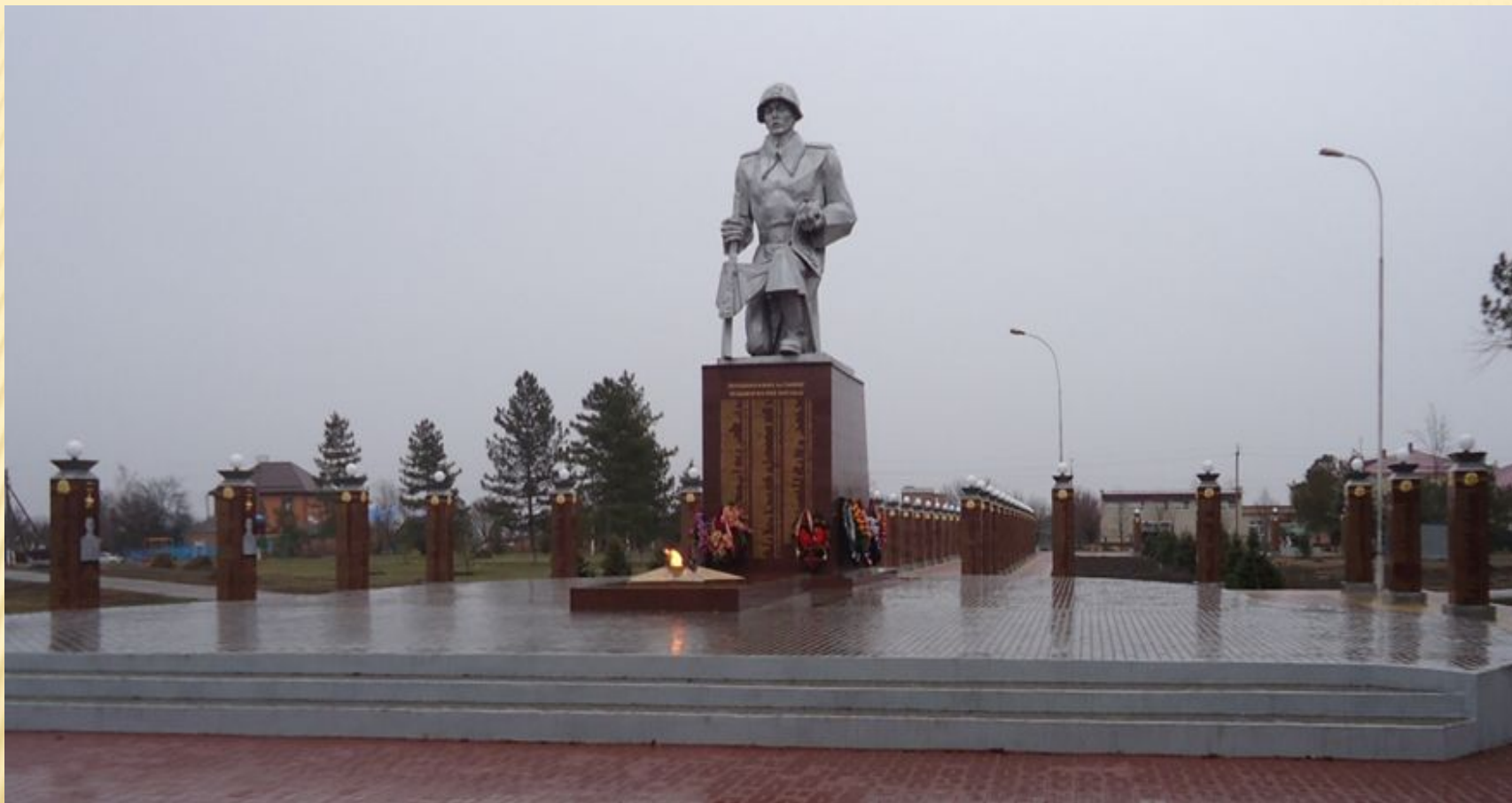
Точка №9. Парк 30-летия Победы.