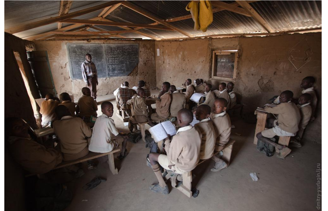
Начальная школа в Кении