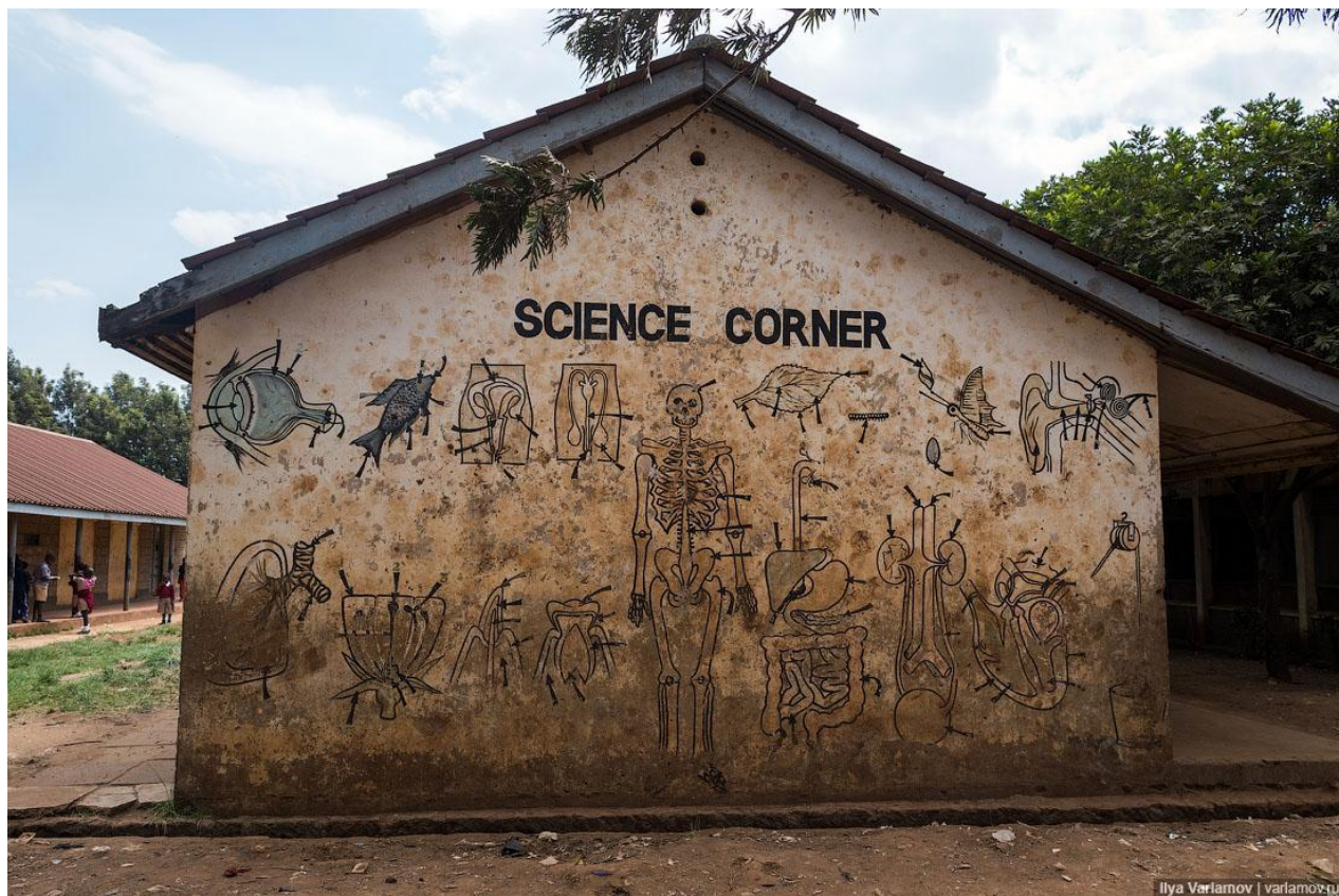
Наглядное пособие по анатомии в Кении