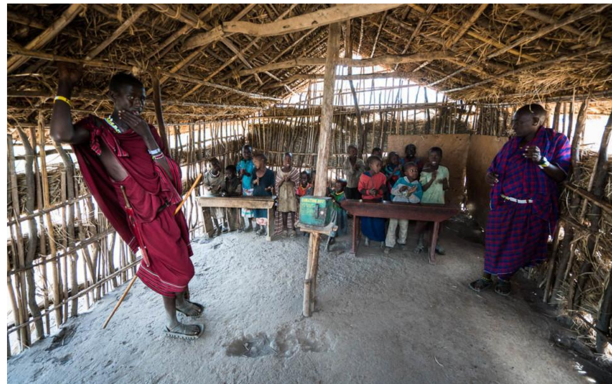
Начальная школа масаев в Танзании