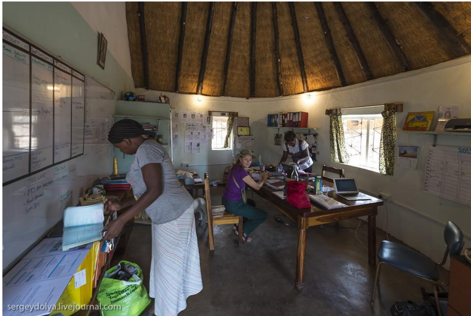
Кабинет директора школы в Замбии