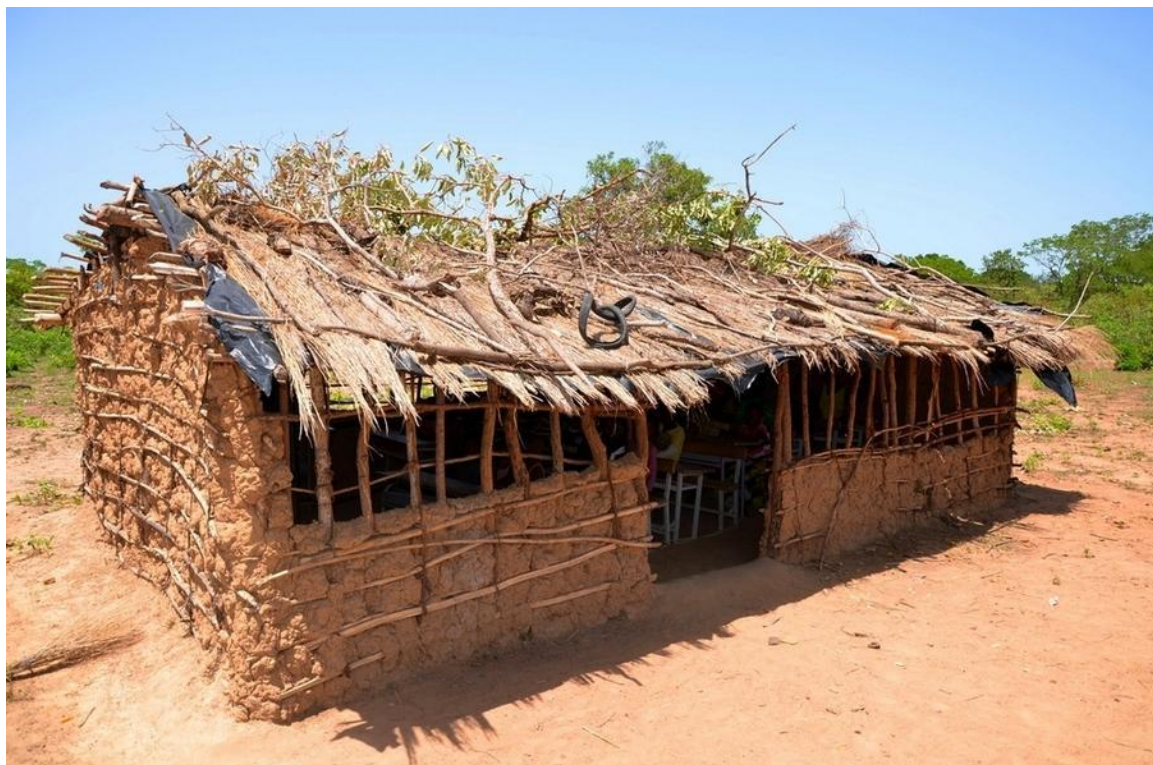
Здание начальной школы в Буркина-Фасо