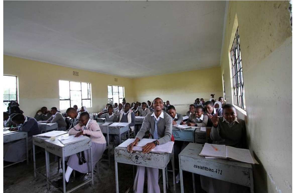
Ученики в новой средней школе Танзании