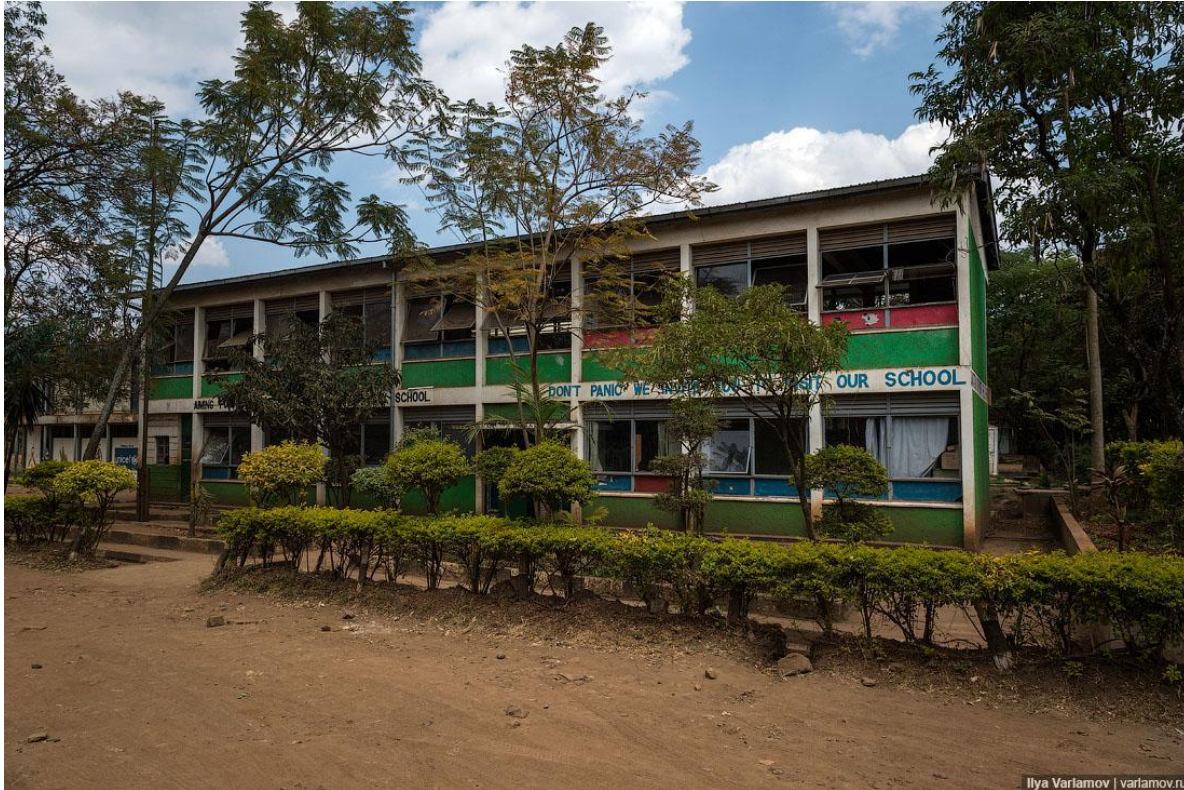
Здание средней школы в Кении