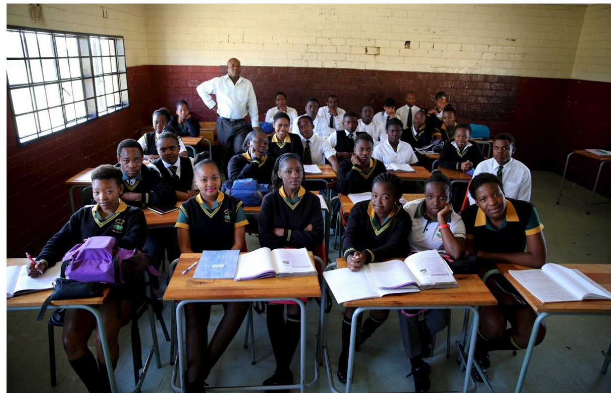
Ученики 11-го класса в Соуэто, ЮАР