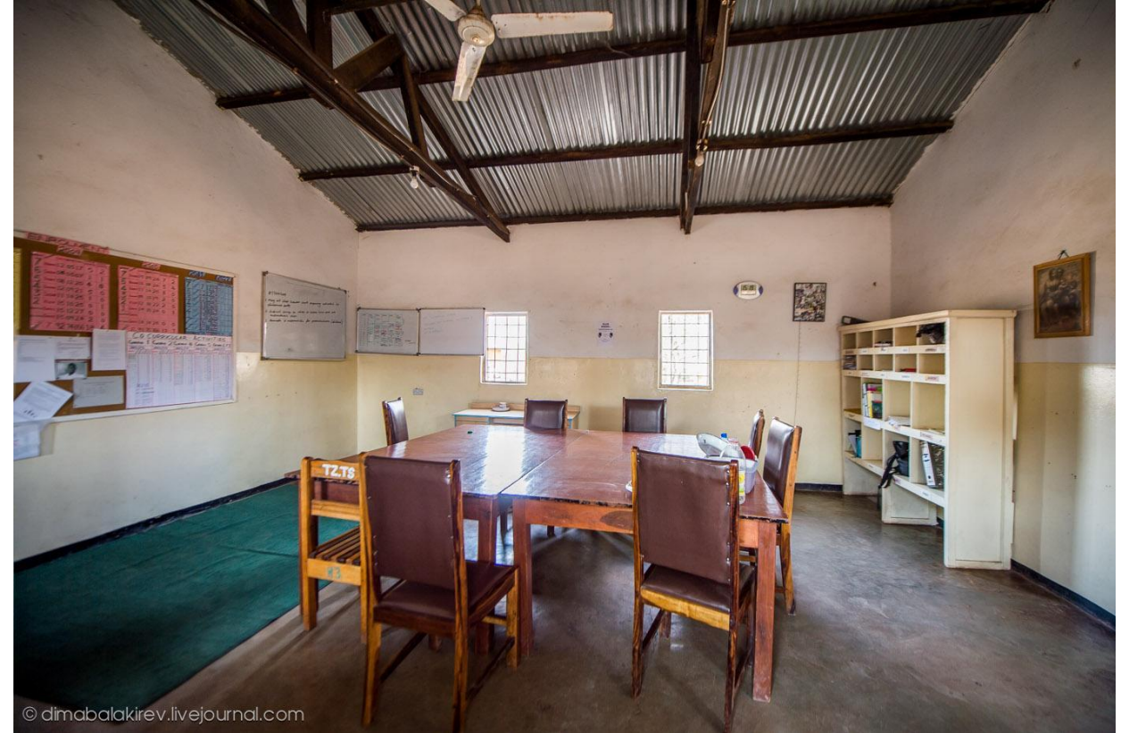
Школьная учительская в Замбии