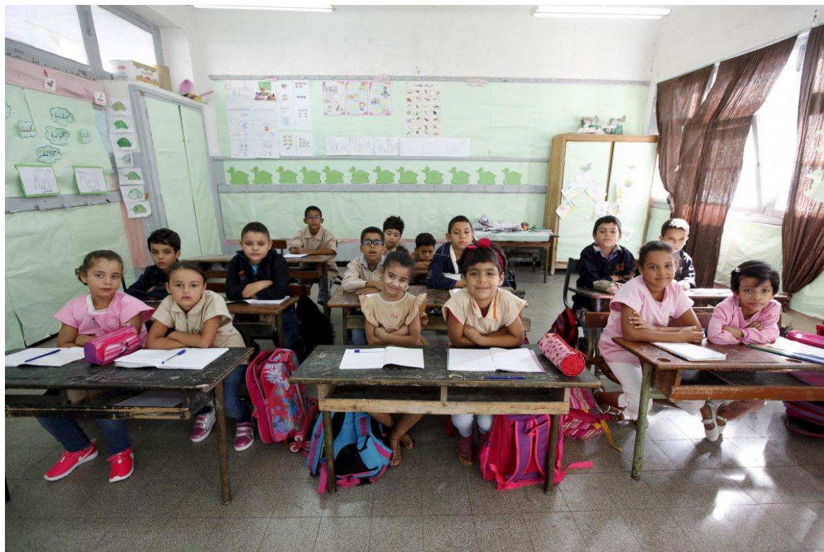
Начальная школа города Туниса