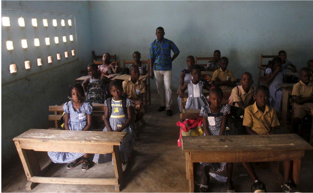
Начальная школа в Абиджане, Кот-д'Ивуар