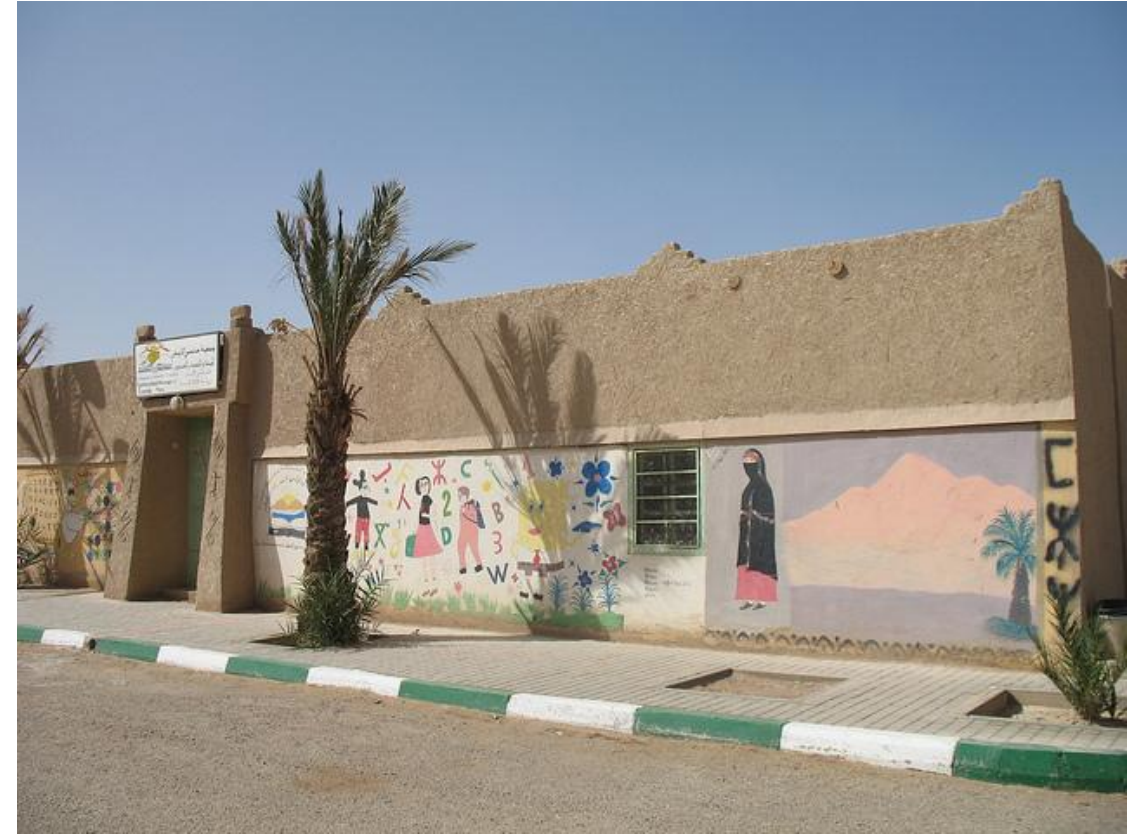
Школа в Марокко