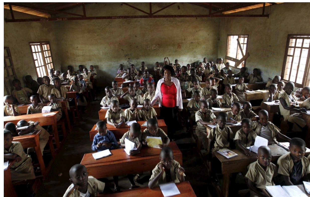
Начальная школа в Бужумбуре, Бурунди