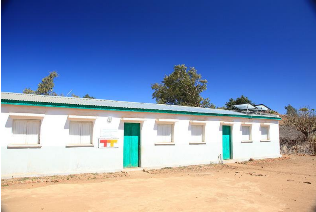
Здание местной школы в Мадагаскаре