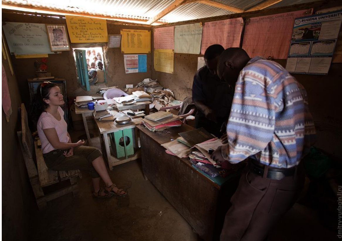
Школьная учительская в Кении