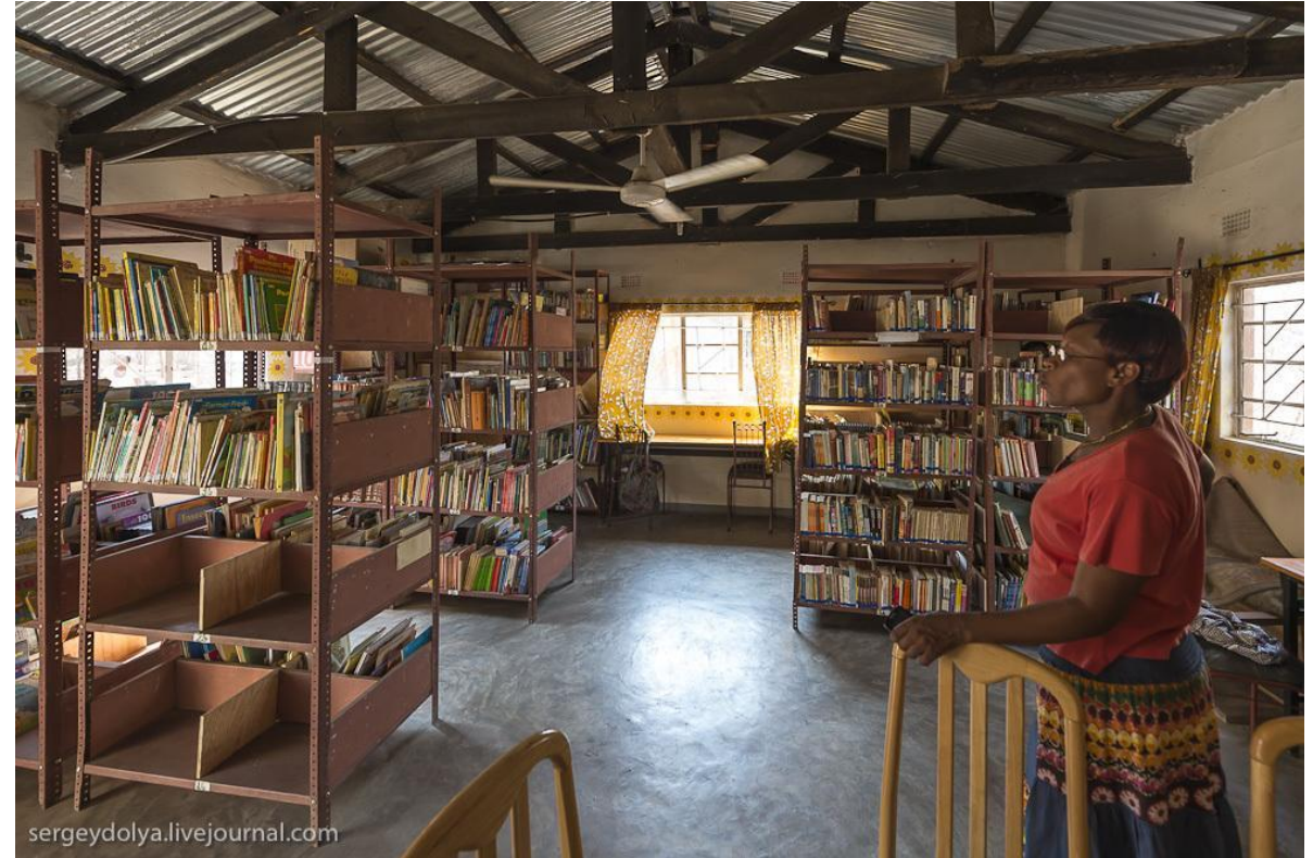
Школьная библиотека в Замбии (фонд — 4 000 книг)