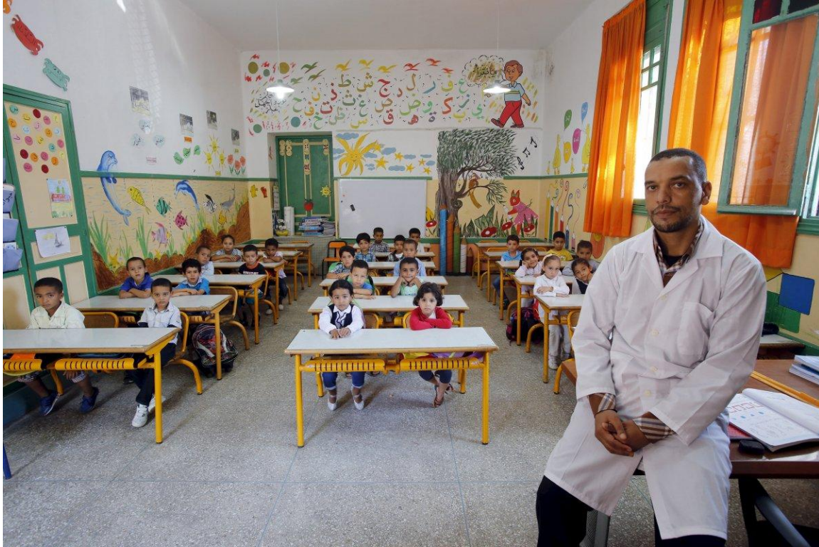
Начальная школа в Рабате, Марокко