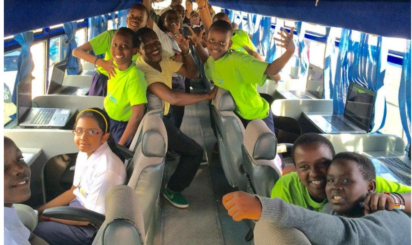
Мобильный компьютерный класс в автобусе, Руанда