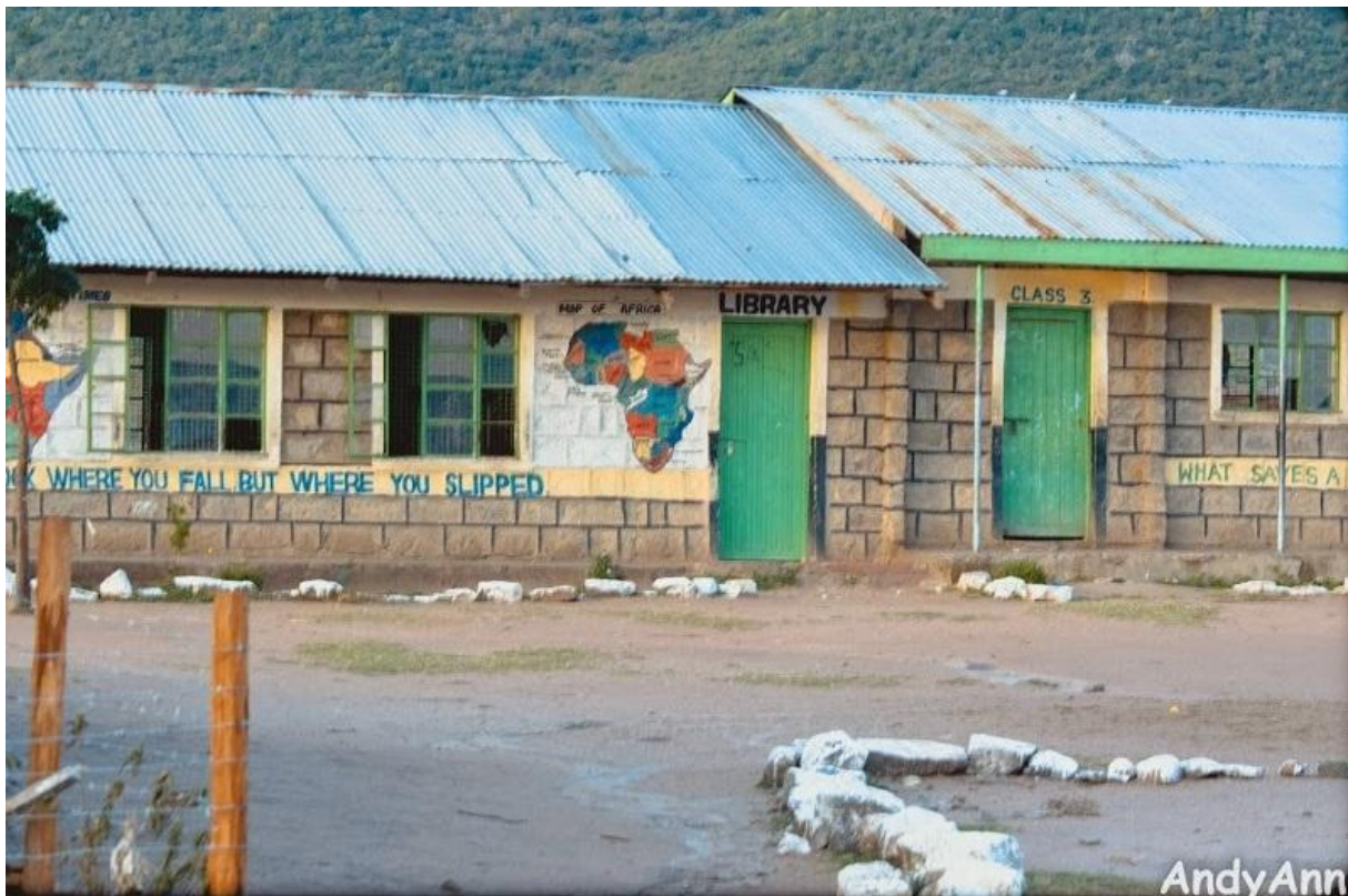
Здание начальной школы в Танзании