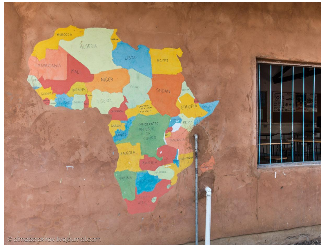
Наглядное пособие по географии в Замбии