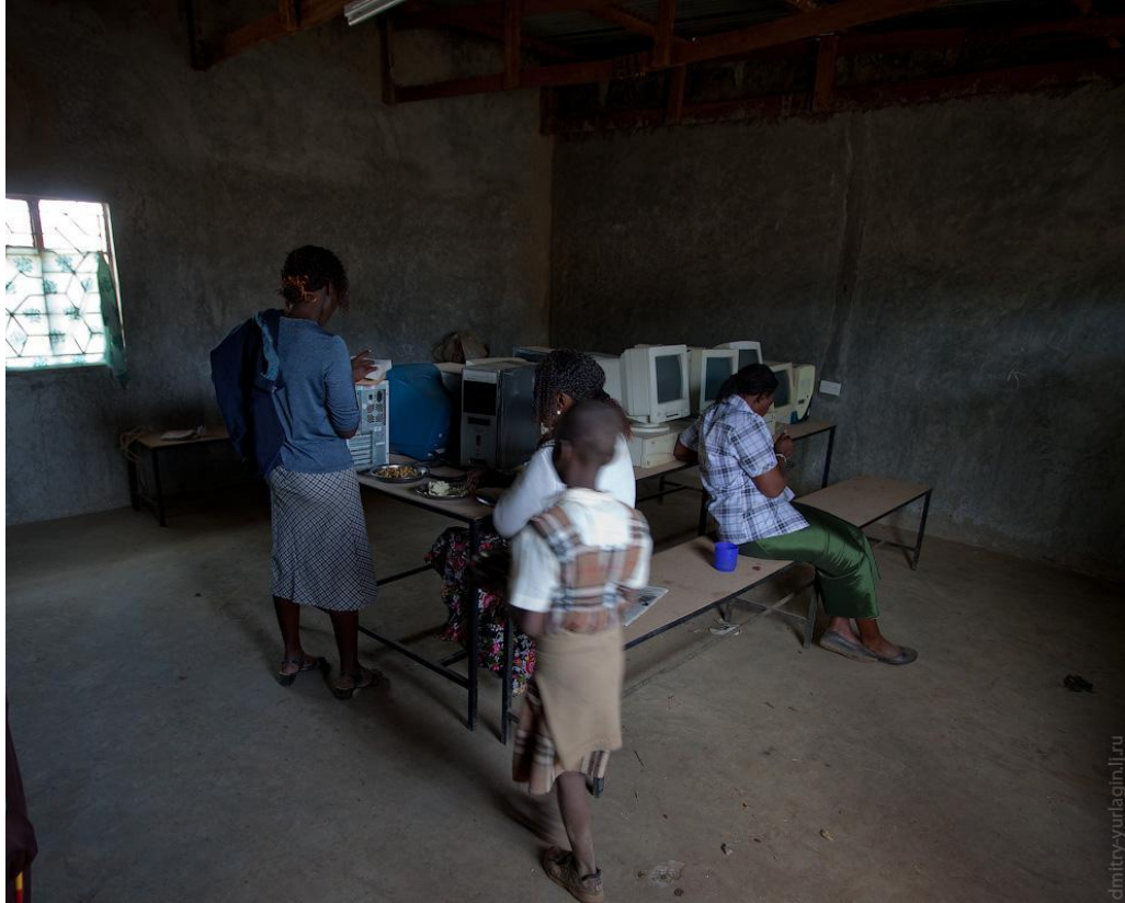
Компьютерный класс в Кении