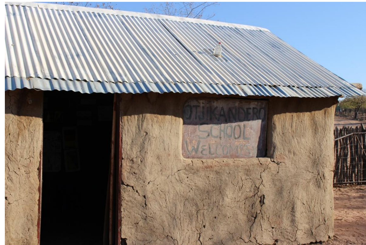
Здание начальной школы в Намибии