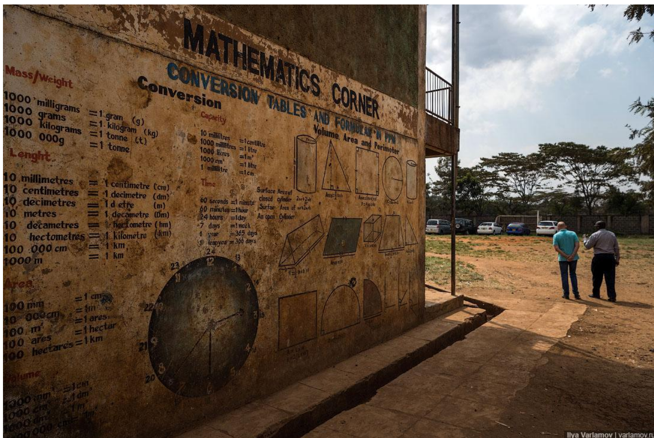
Наглядное пособие по математике в Кении