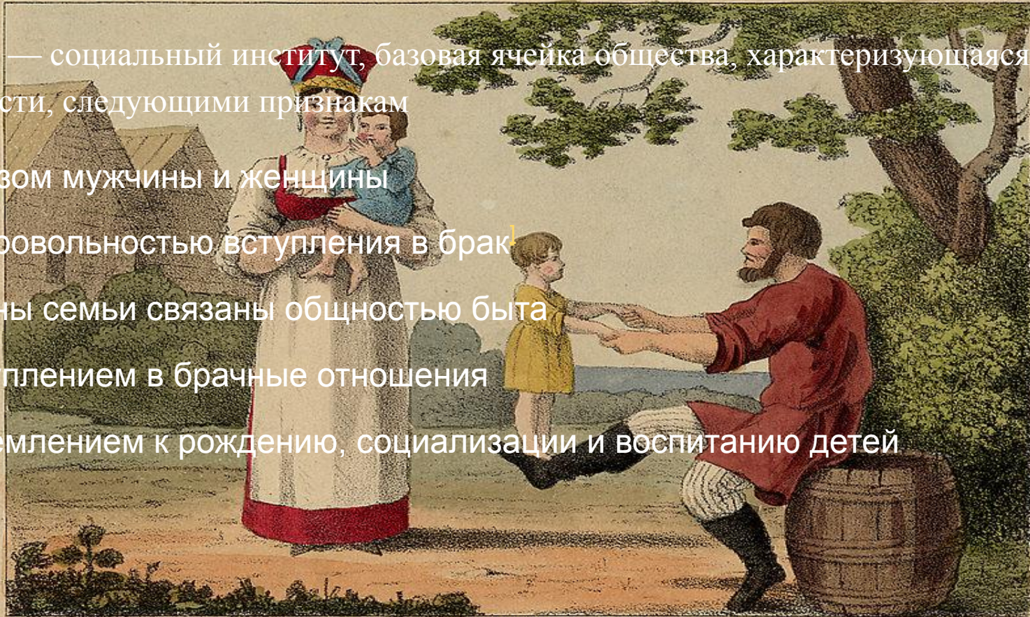
THE MOUJICK AND FAMILY.

стремлением к рождению, социализации и воспитанию детей