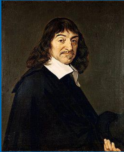
Рене Декарт 1596-1650

Французский философ, математик, физик и физиолог, основоположник рационализма Нового времени.