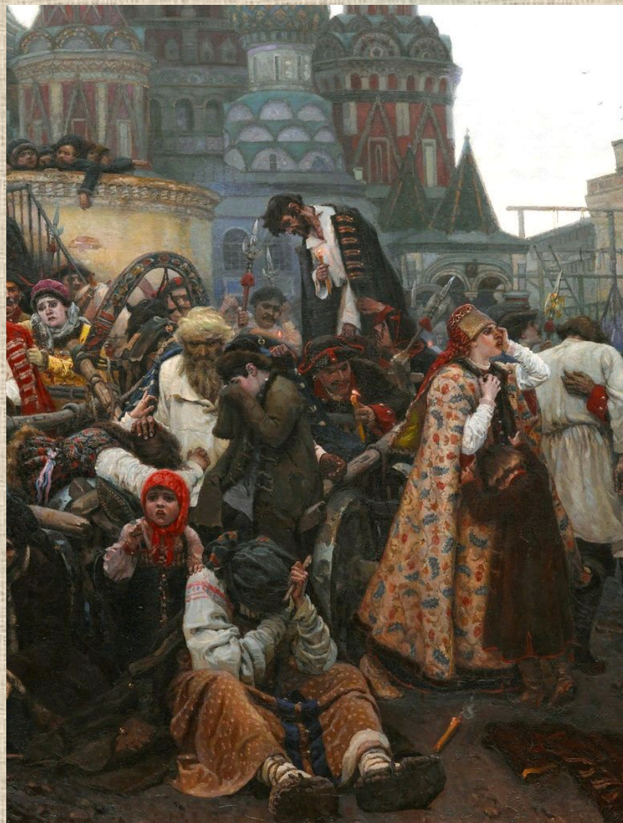
Утро стрелецкой казни. Фрагмент

После написания полотна вступает в Товарищество Передвижных Художественных Выставок.