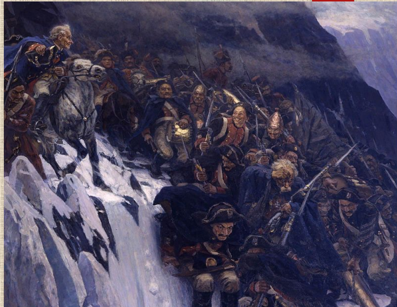
Переход Суворова через Альпы