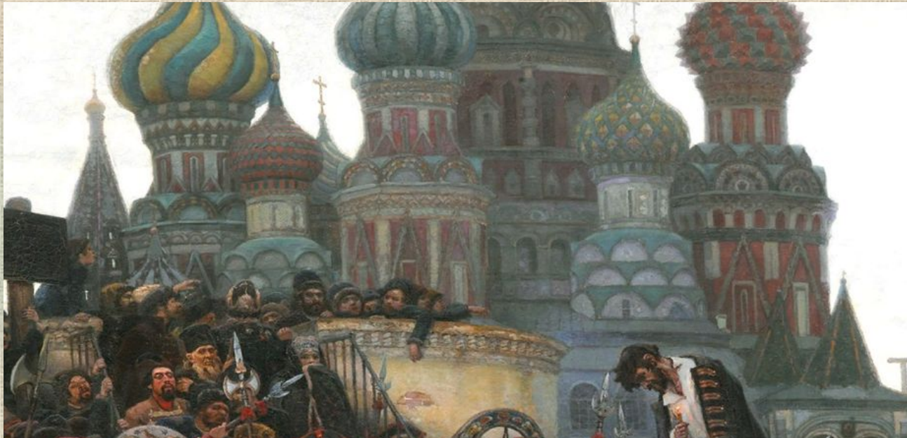
Фрагменты картины «Утро стрелецкой казни»