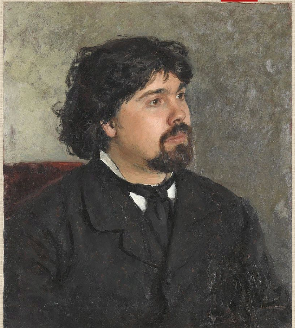
Портрет В. И. Сурикова работы И. Е. Репина (1877)

(1848 -1916) - русский художник, мастер исторической живописи. Картины Василия Сурикова оживили мир ушедших эпох русской истории. Мастерство Сурикова как тонкого колориста и великолепно владеющего композицией художника сделало его одной из главных фигур отечественной живописи. Более 25 лет он состоял в Товариществе передвижных выставок.