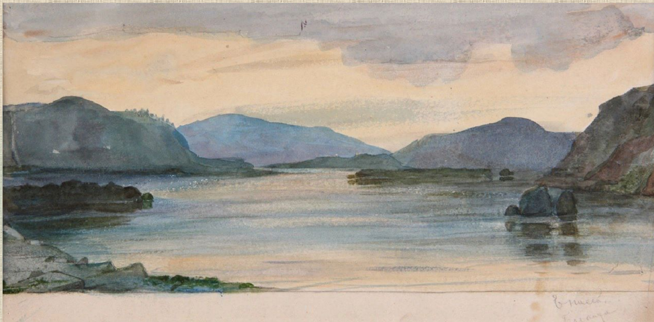
Енисей. Устье Базаихи.

Здесь, в Красноярске, в городе своей юности, он написал несколько работ, запечатлевших достопримечательности Красноярска и прекрасного Енисея.