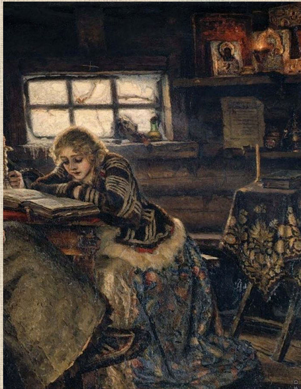
Фрагменты полотна «Меншиков в Березове»