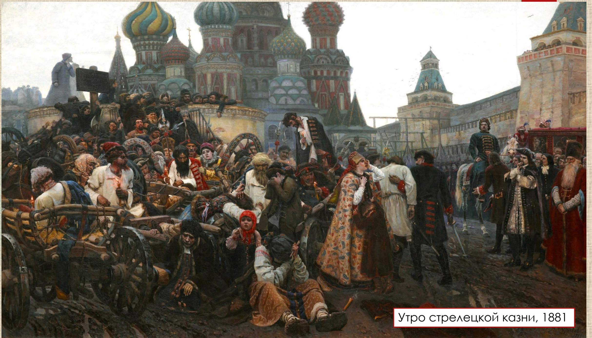
Утро стрелецкой казни, 1881