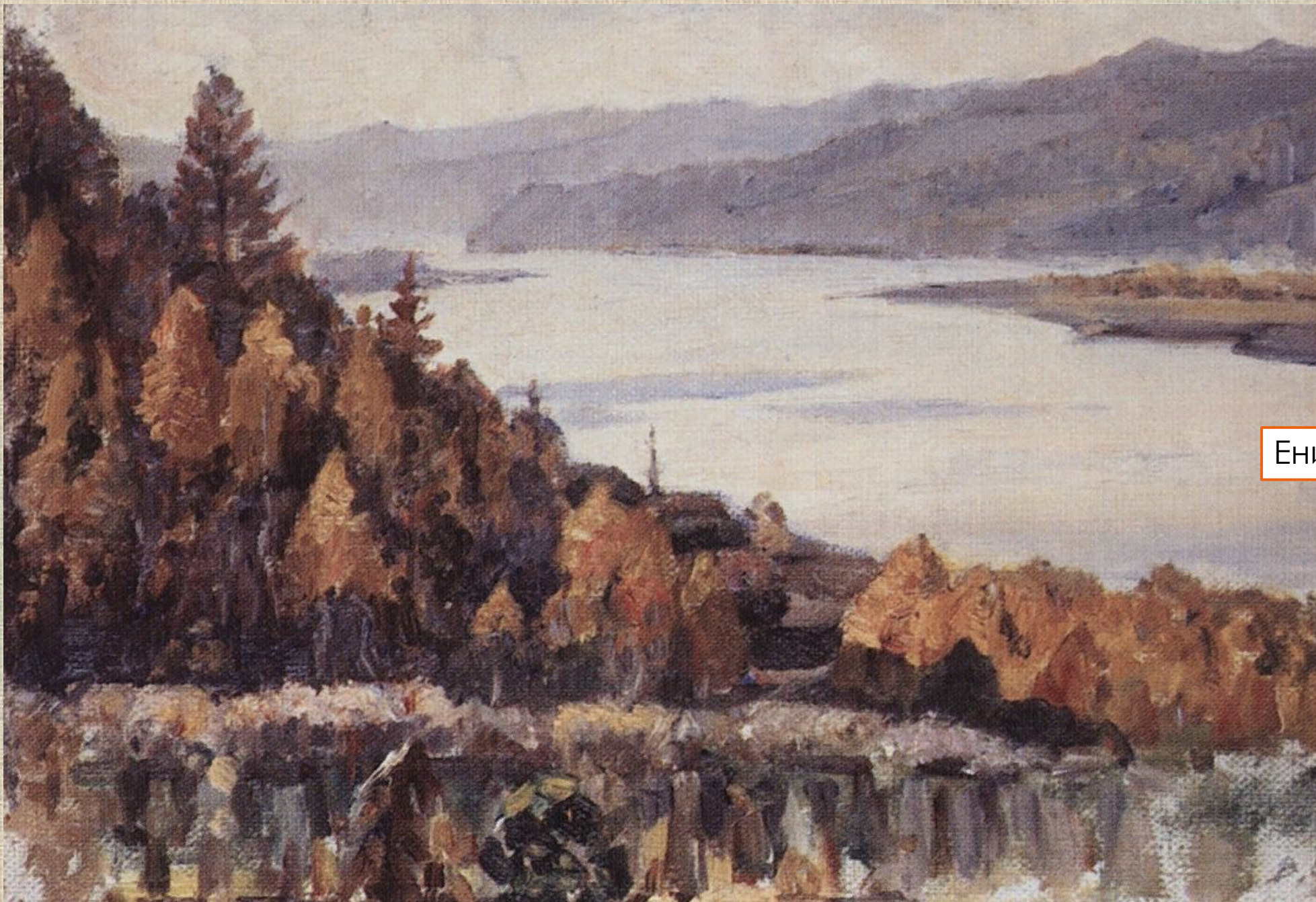
Енисей у Красноярска