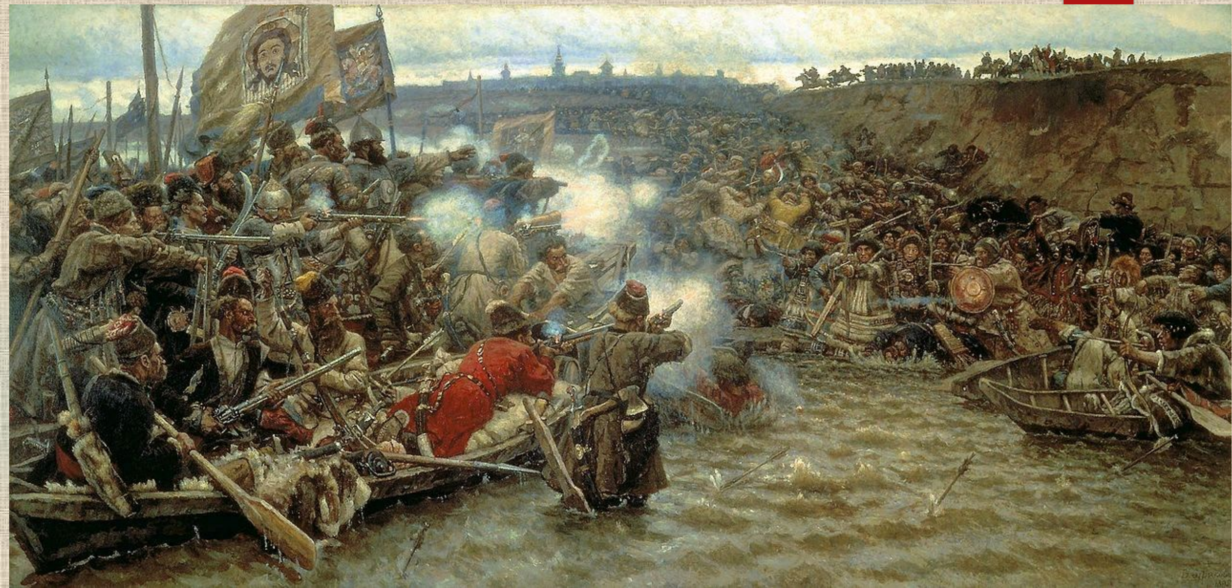
Покорение Сибири Ермаком Тимофеевичем