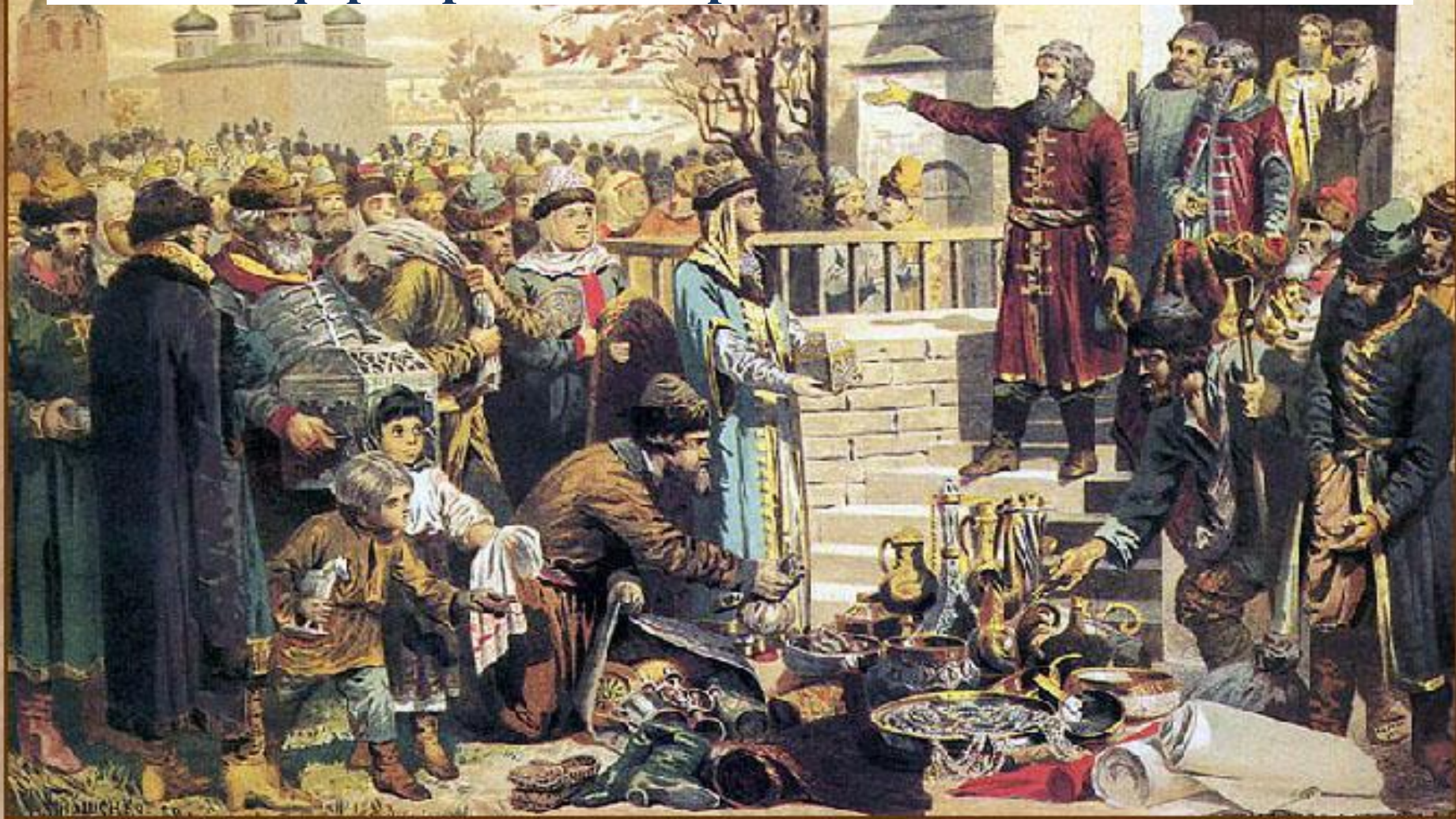
Воззвание Козьмы Минина к нижегородцам

Осенью 1611 г. по призыву нижегородского купеческого старосты К. Минина началось формирование народного ополчения.