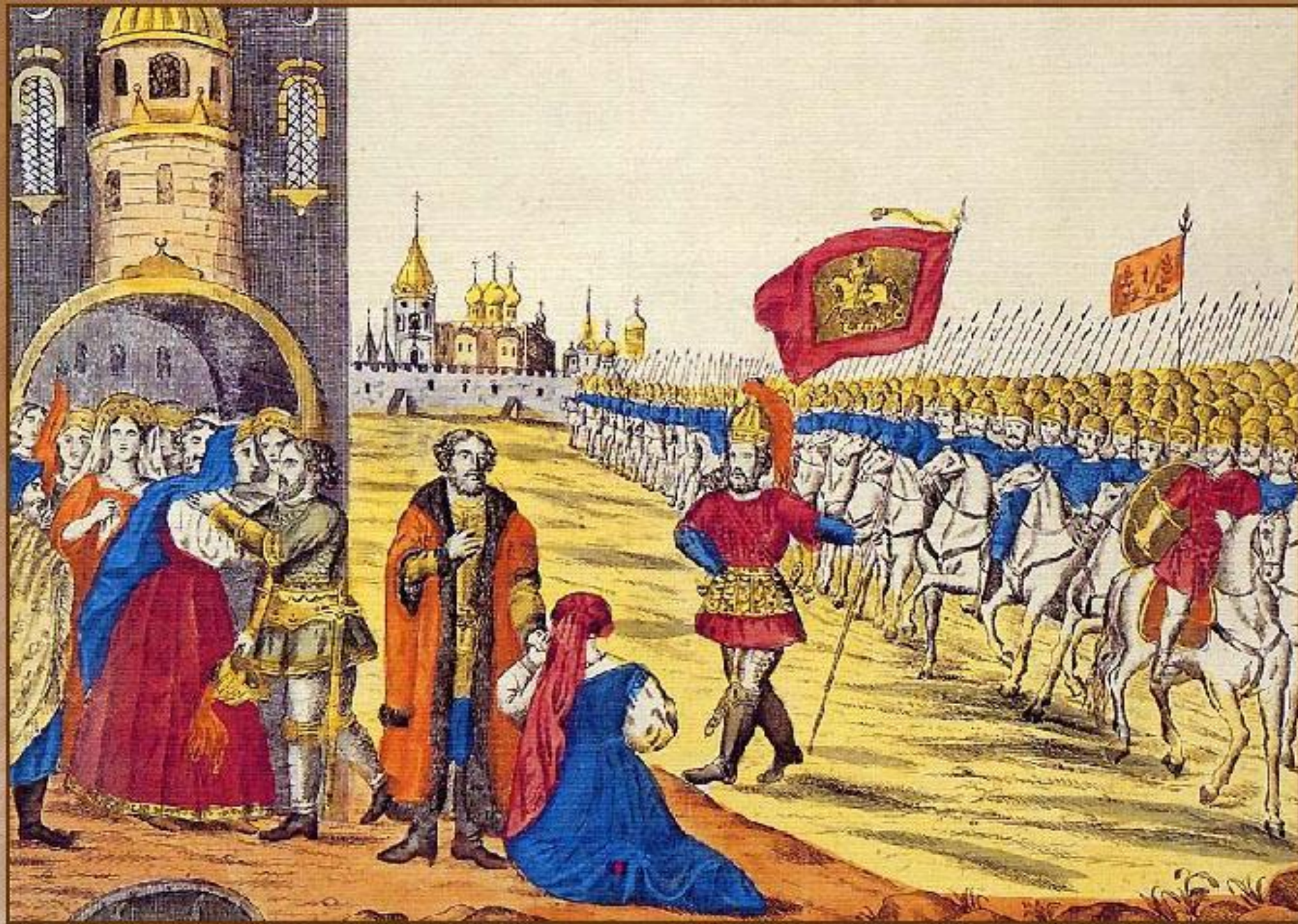
Гражданин Минин и князь Пожарский