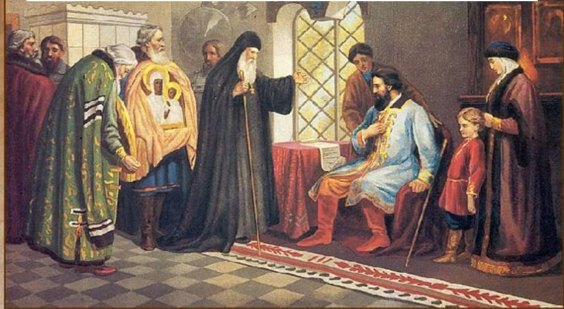
Нижегородские послы у князя Дмитрия Пожарского. 1611 г.