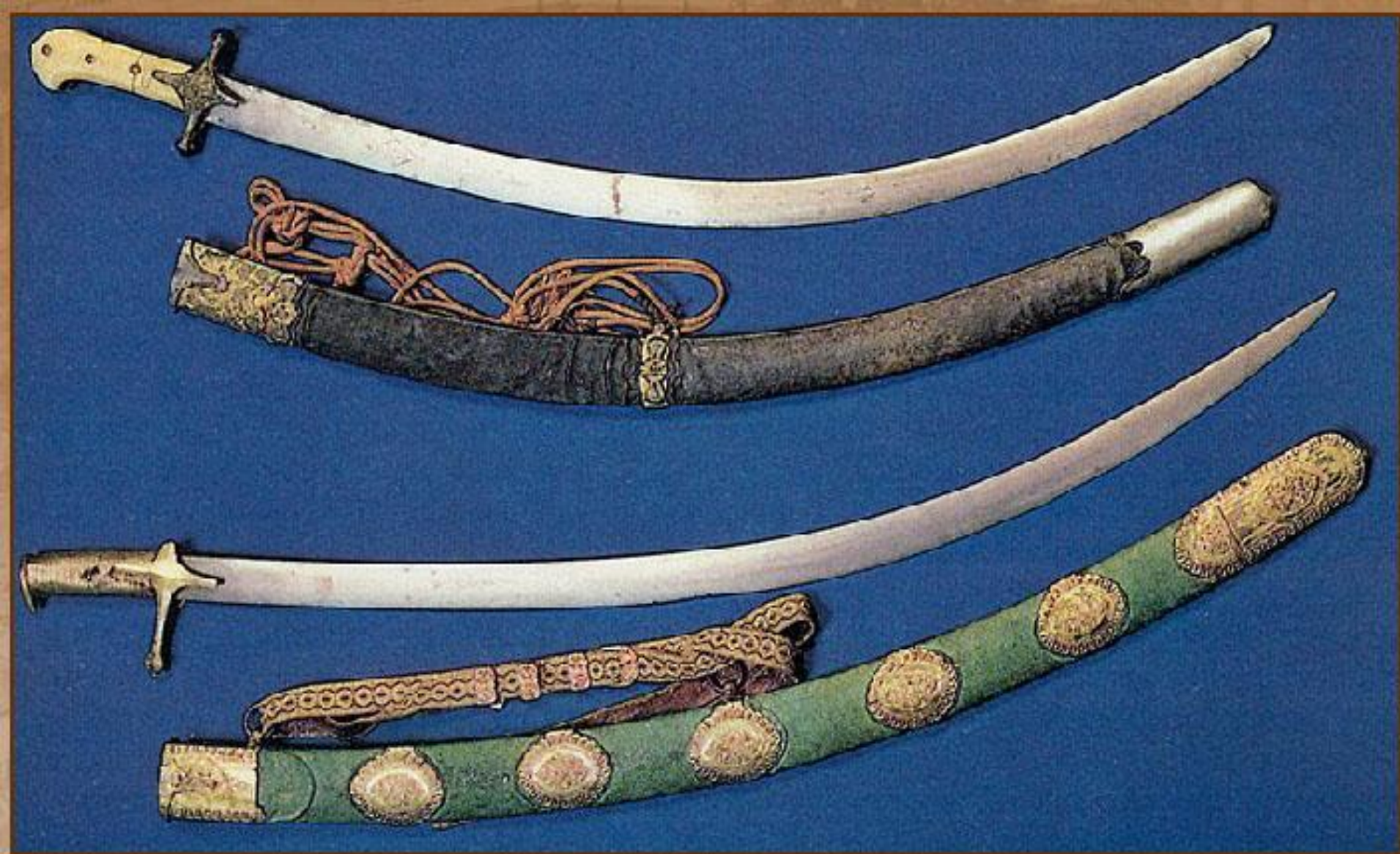
Сабли К. Минина и Д. Пожарского