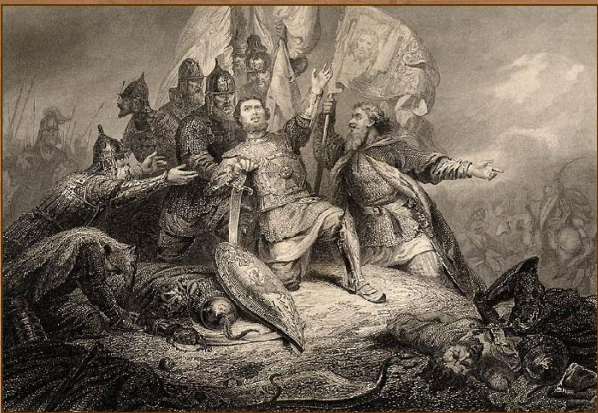
Пожарский в битве под Москвой