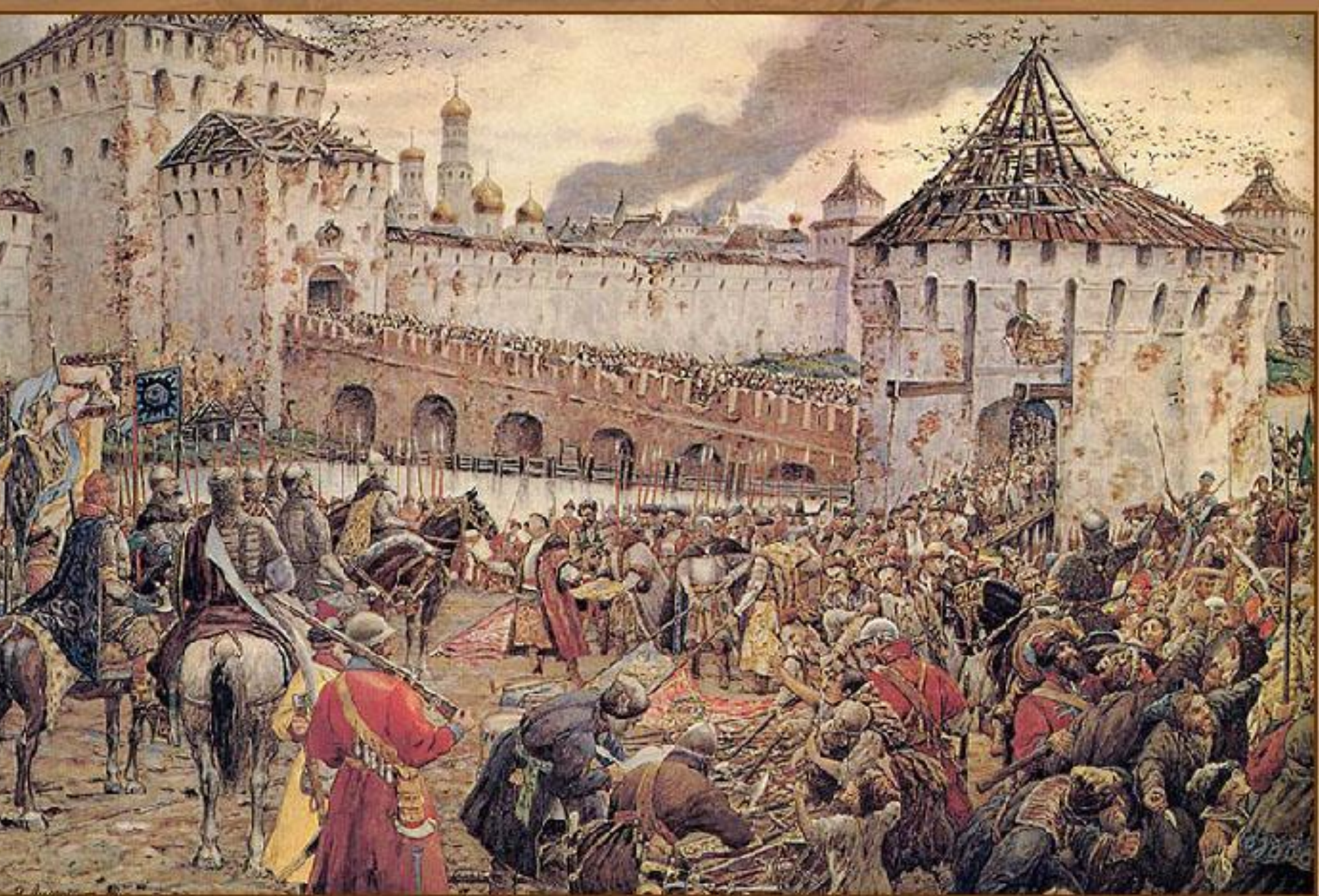
Изгнание польских интервентов из Московского Кремля в 1612 г.