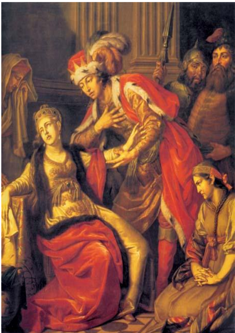
«Владимир и Рогнеда» (1770).