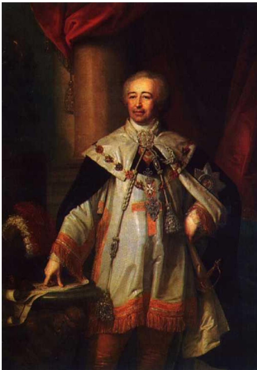
Портрет статс-секретаря Д. П. Трощинского (ок. 1795)