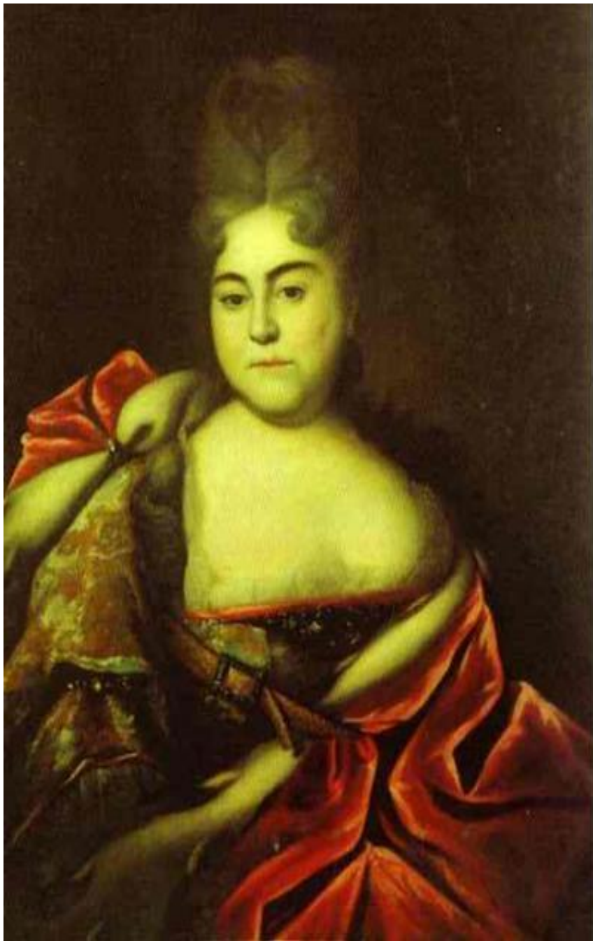
«Портрет царевны Натальи Алексеевны»