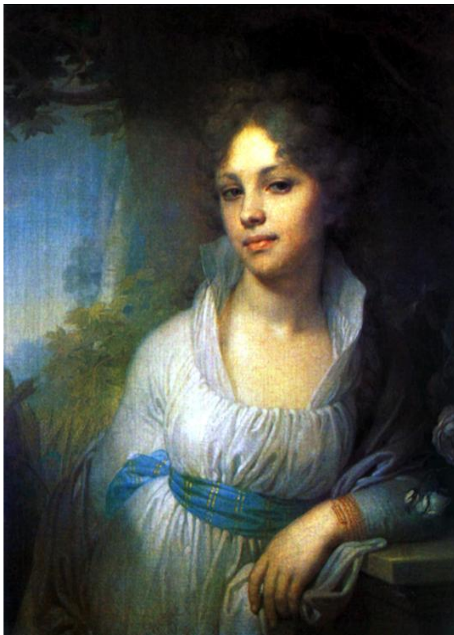
Портрет М.И. Лопухиной