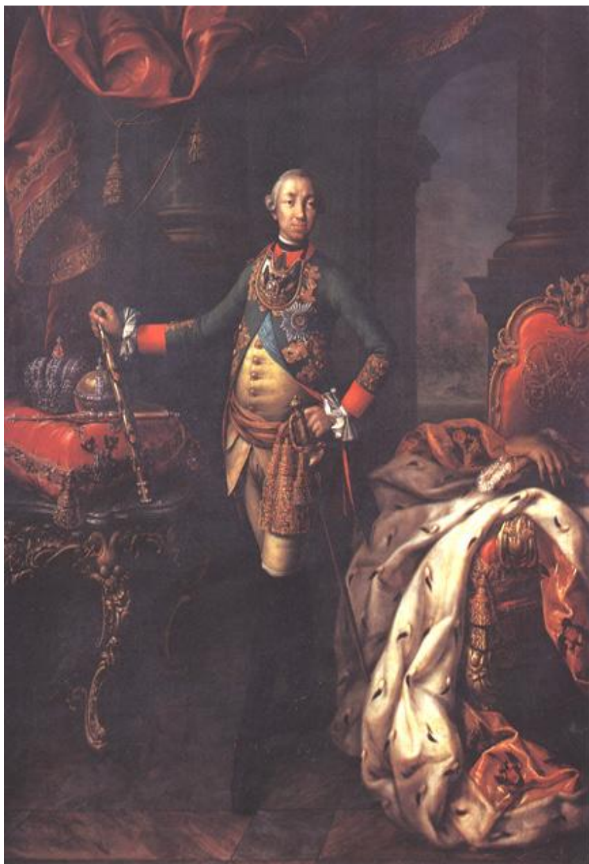
«Портрет императора Петра III» (1762), выполненный художником для Сената.