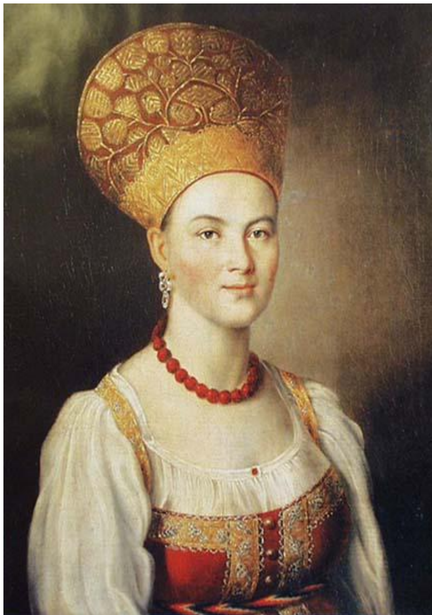
«Портрет неизвестной крестьянки в русском костюме» (1784)