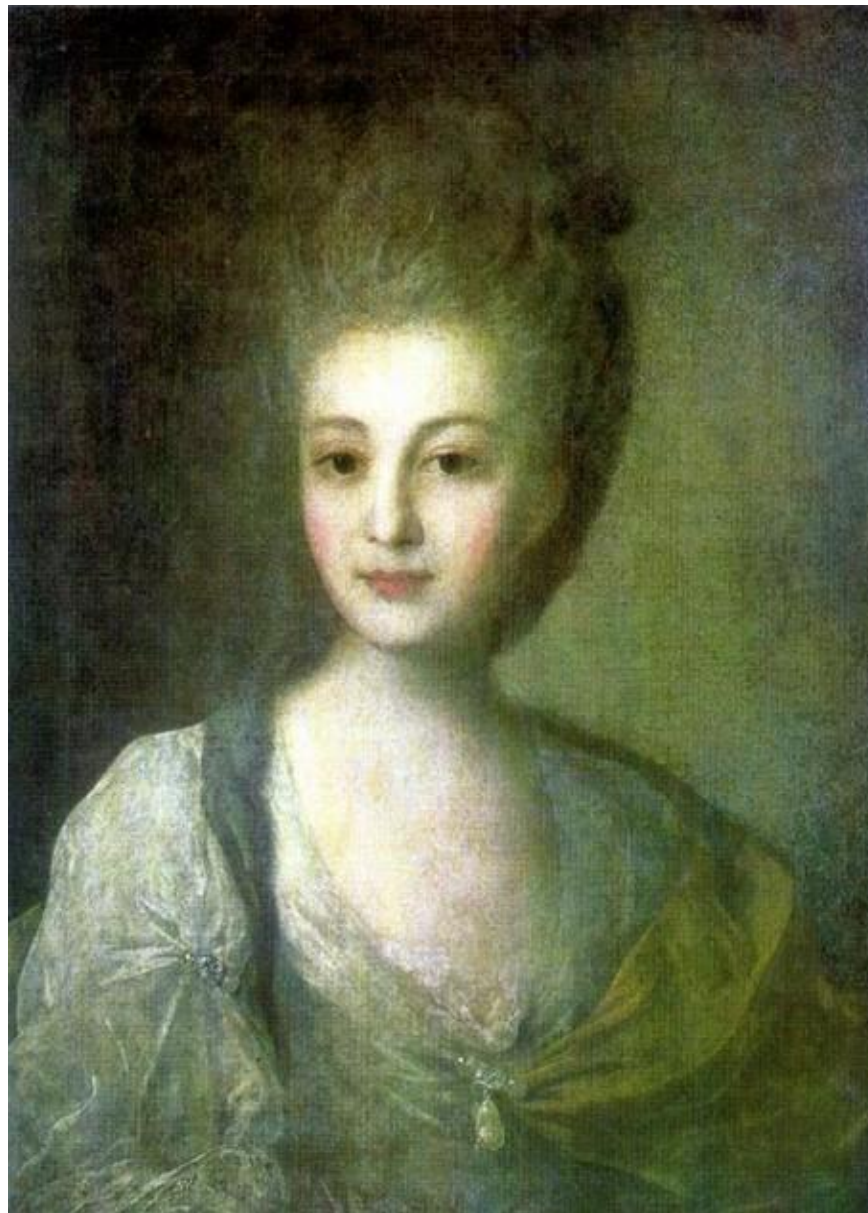
Портрет А. П. Струйской