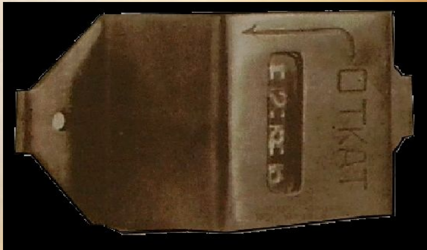
Инерционный счетчик выстрелов из танковой пушки