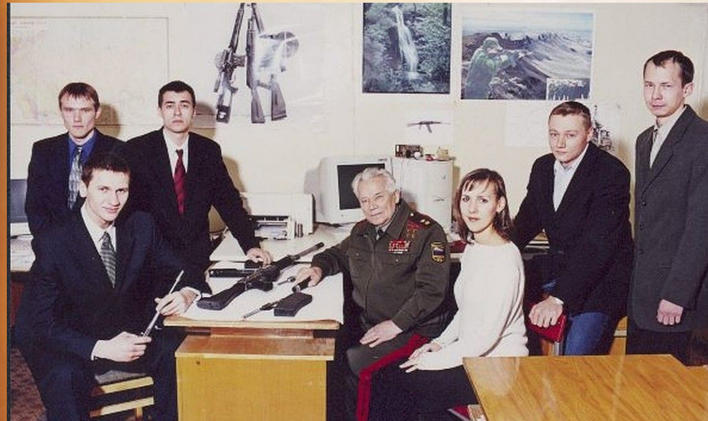
М. Т. Калашников со

Почетный профессор ИжГТУ, доктор технических наук М. Т. Калашников был частым гостем вуза и участником самых значительных событий в жизни университета. Он принимал непосредственное участие в подготовке молодых кадров конструкторов-оружейников.