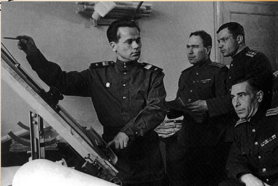
М. Калашников разрабатывает знаменитый автомат

В 30 лет Михаил Калашников стал лауреатом Сталинской премии. Конструктор получил орден Красной Звезды за уникальную разработку автомата. Сразу же после этого автомат был передан в производство Ижевскому оружейному заводу. Конструктор перебрался в Удмуртию для активного участия в создании оружия. Михаил Тимофеевич постоянно совершенствовал изобретения.