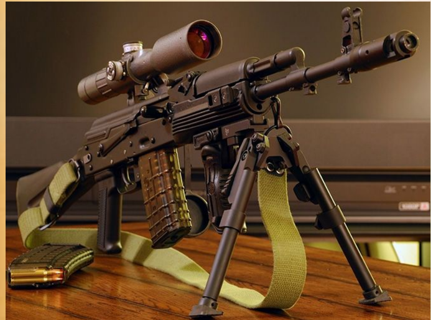
Автомат Калашникова 100-1