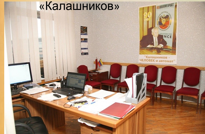
Рабочий кабинет в концерне