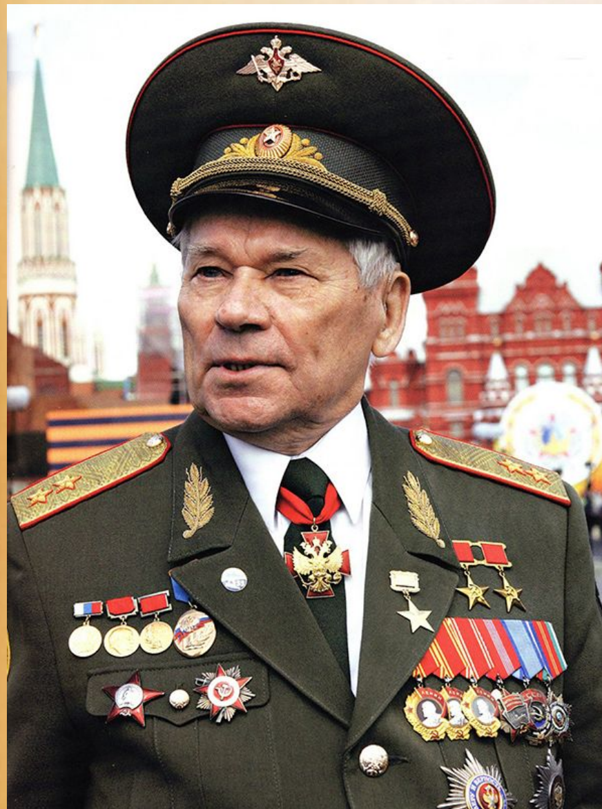
Михаил Тимофеевич Калашников