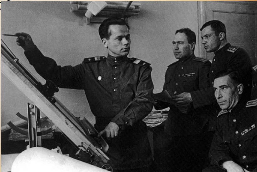
М. Калашников разрабатывает знаменитый автомат

В 30 лет Михаил Калашников стал лауреатом Сталинской премии. Конструктор получил орден Красной Звезды за уникальную разработку автомата. Сразу же после этого автомат был передан в производство Ижевскому оружейному заводу. Конструктор перебрался в Удмуртию для активного участия в создании оружия. Михаил Тимофеевич постоянно совершенствовал изобретение.