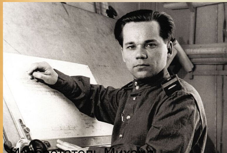
Изобретатель Михаил Калашников

После того как собственный образец довели до нужной кондиции, Калашников отправил его на конкурс. Несмотря на то, что оружие конкурс не прошло, талант конструктора заметили.