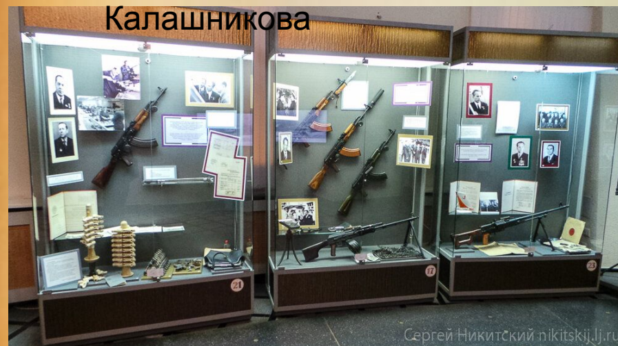
Музейно-выставочный комплекс стрелкового оружия