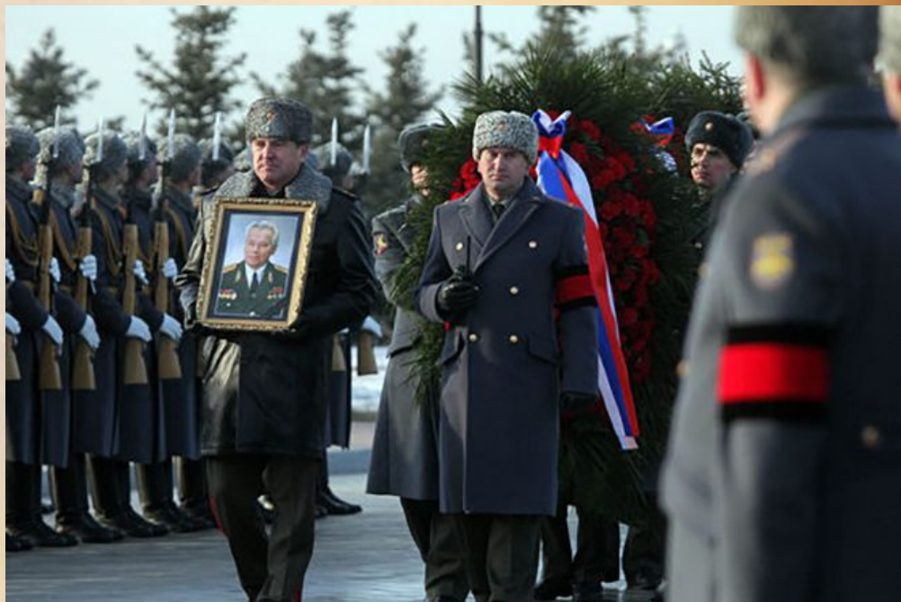
Похороны Михаила Калашникова

Михаил Тимофеевич скончался 23 декабря 2013 года в возрасте 94 лет.