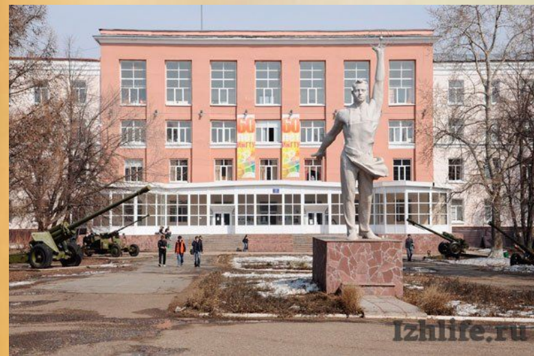
Второй корпус ИжГТУ