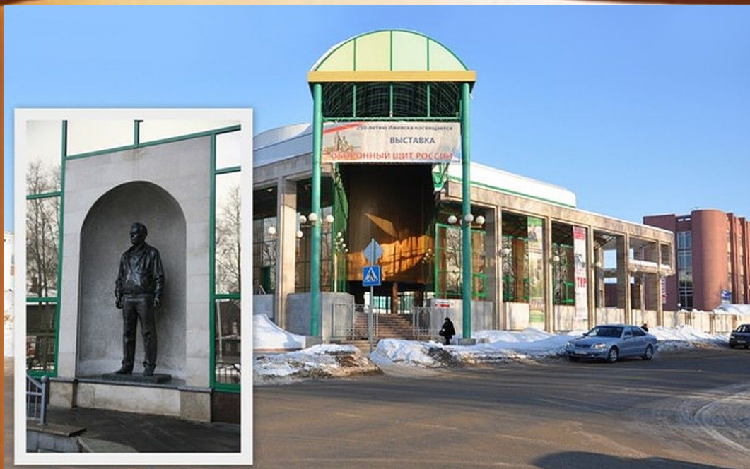
Музей имени Калашникова

В комплексе создан демонстрационный зал, включающий тир огнестрельного оружия, где представлены различные образцы исторического и современного оружия. Также пневматический и арбалетный тир, оснащенный мультимедийными программами.