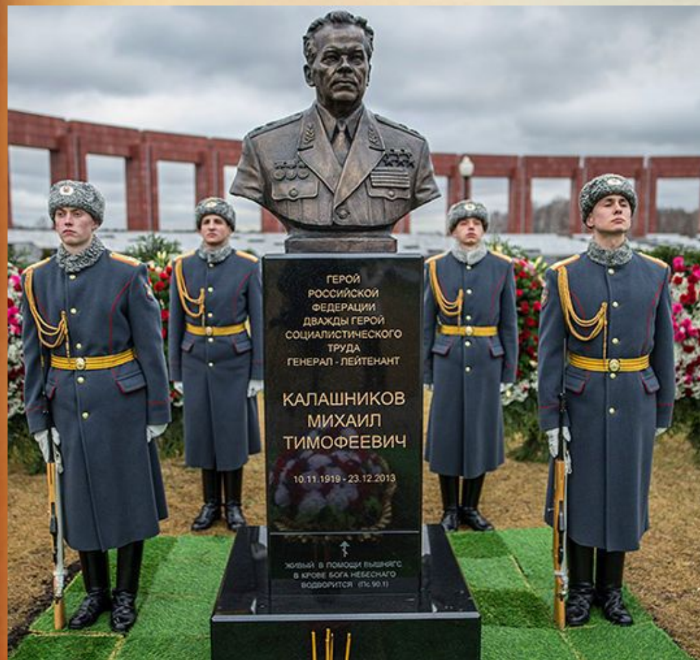
Могила Михаила Калашникова

М. Т. Калашников похоронен в Пантеоне Героев Федерального военного мемориального кладбища в Московской области.