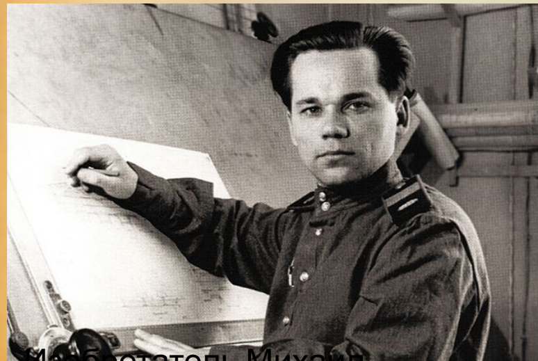
Изобретатель Михаил Калашников

После того как собственный образец довели до нужной кондиции, Калашников отправил его на конкурс. Несмотря на то, что оружие конкурс не прошло, талант конструктора заметили.