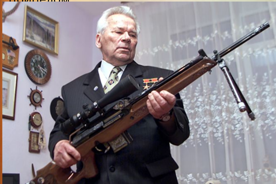
Михаил Калашников и охотничий карабин «Сайга»

В 1992 году мастер создает самозарядный охотничий карабин «Сайга», оснащенный оптическим прицелом.