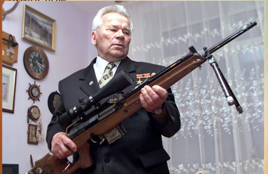
Михаил Калашников и охотничий карабин «Сайга»

В 1992 году мастер создает самозарядный охотничий карабин «Сайга», оснащенный оптическим прицелом.