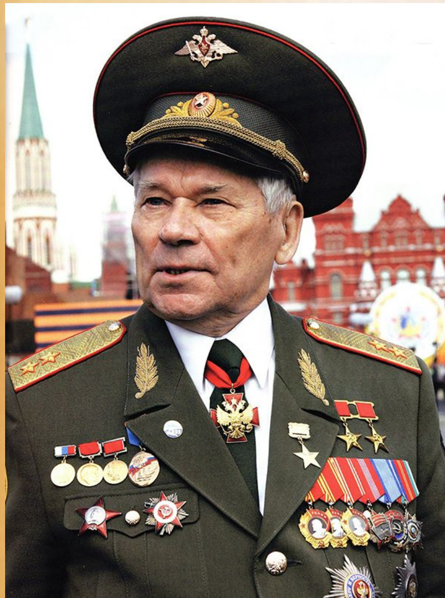
Михаил Тимофеевич Калашников