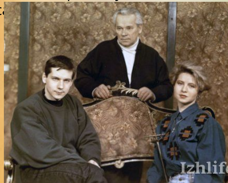
Михаил Калашников с внуками