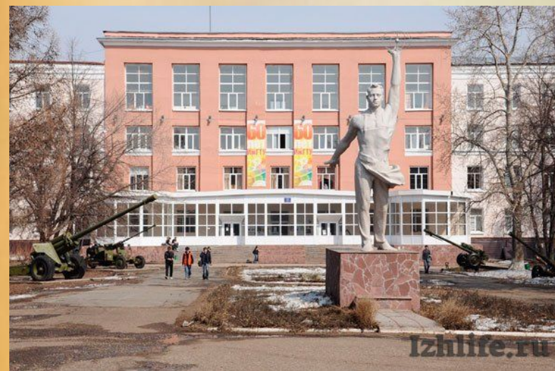
Второй корпус ИжГТУ