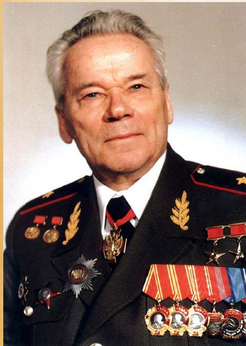
Калашников Михаил Тимофеевич