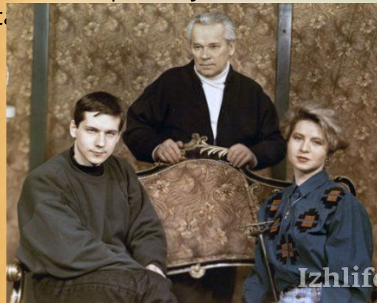
Михаил Калашников с внуками