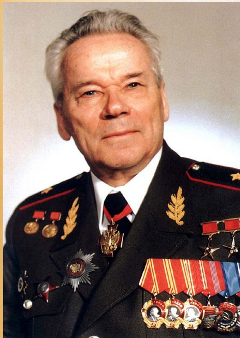
Калашников Михаил Тимофеевич