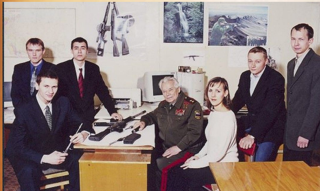
М. Т. Калашников со

Почетный профессор ИжГТУ, доктор технических наук М. Т. Калашников был частым гостем вуза и участником самых значительных событий в жизни университета. Он принимал непосредственное участие в подготовке молодых кадров конструкторов-оружейников.