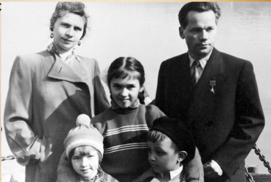
Михаил Калашников с женой и детьми