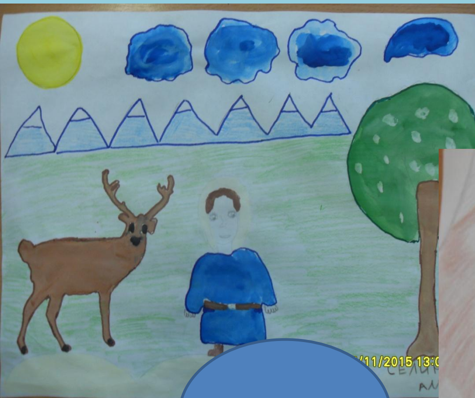
«Конёк-горбунок» Селина Алла 5Б