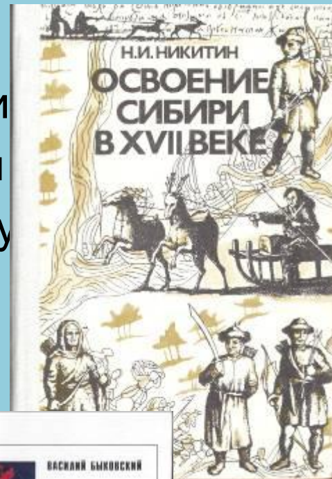
Ямало-Ненецкий автономный округ