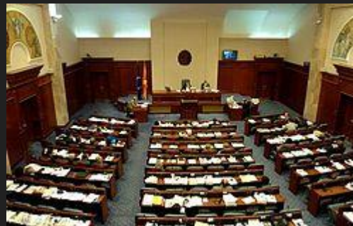
Эта фотография, автор: неизвестен, лицензия: CC BY-SA .