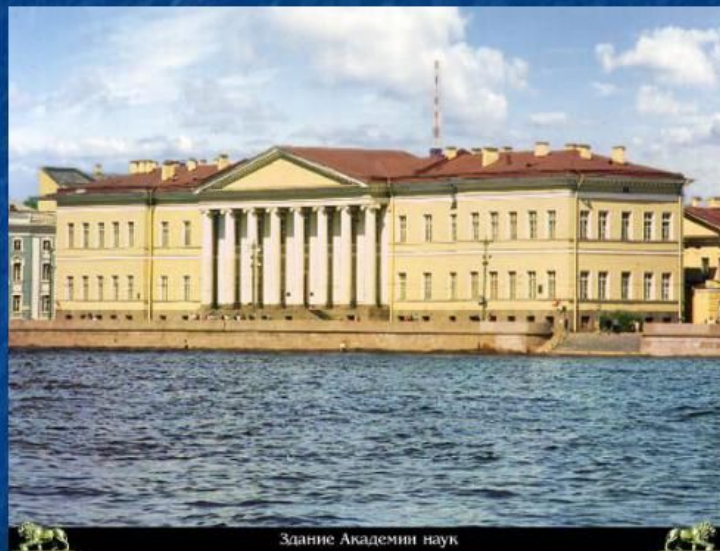
Здание Академии наук