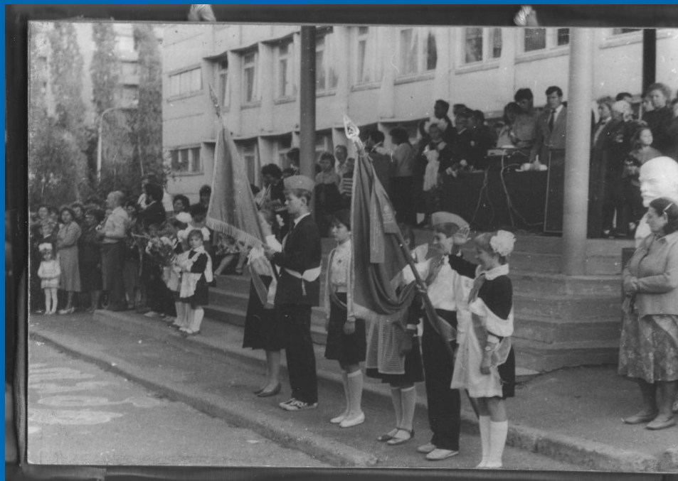
1981 год- Школа № 86