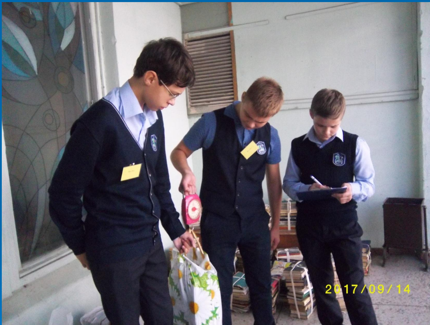
Ежегодная экологическая акция «Чистая Земля» Конкурс «Лучший защитник природы»