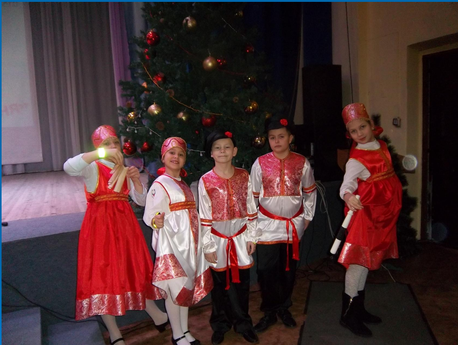
Победители ежегодных городских творческих конкурсов по ПДД