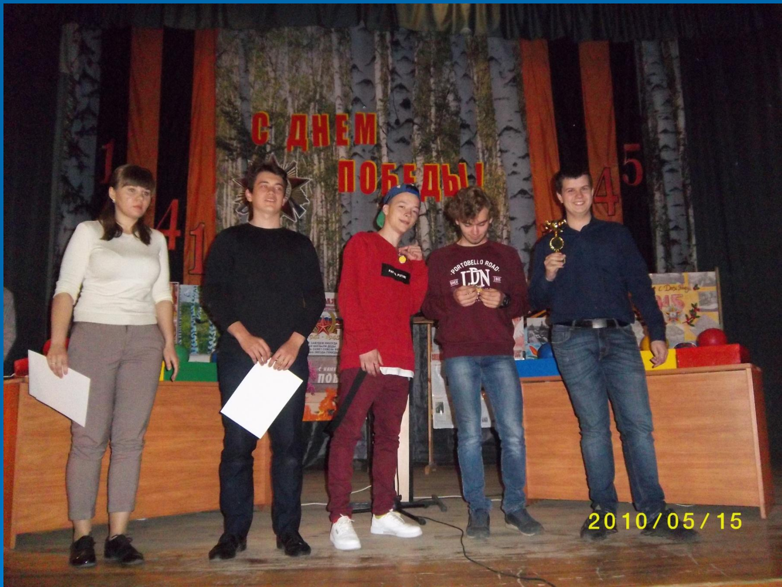
Призёры интеллектуальной игры «Ворошиловский стрелок»